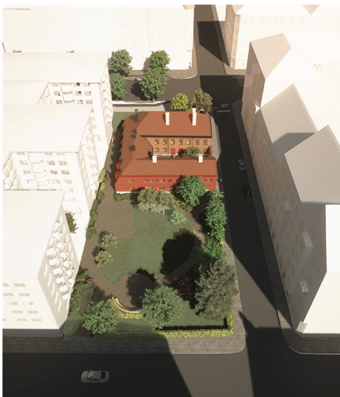
Drönaperspektiv mot öster. Föreslagen byggnad uppförs i två våningar och ansluter i skala och karaktär till den historiska anläggningen. Illustration: Winroth Arkitekter