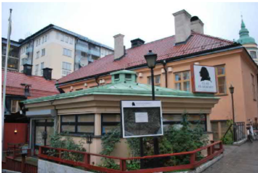
Den hexagonformade rotundan som uppfördes under 1980-talet är placerad vid Surbrunnsgatan.

Under 1980-talet återinvigdes Claes På Hörnet som krog. Hotell- och restaurangverksamhet har bedrivits inom fastigheten sedan dess. Under 1980-talet uppfördes en hexagonformad rotundabyggnad på innergården.