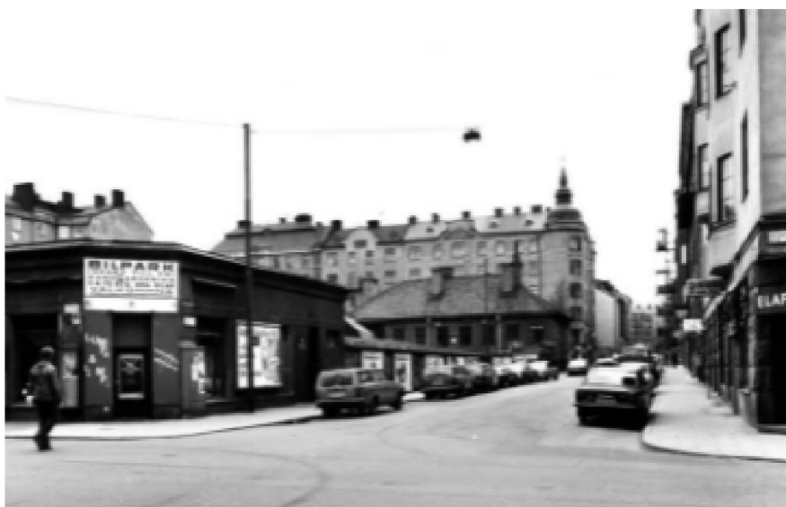
Under 1970-talet låg en bilfirma i hörnet Roslagsgatan Surbrunnsgatan på fastigheten som idag utgörs av Monica Zetterlunds Park.

Monica Zetterlunds Park tillkom i samband med 1970- och 1980-talets exploatering av kvarteret södra del. Dessförinnan var platsen bebyggd med en äldre småskalig bebyggelse.