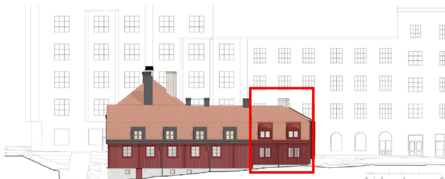
Sektion mot söder som visar hur flygelbyggnadens ansluter till den befintliga byggnadens mansardtak och takkupor. Tillkommande flygelbyggnad markerad med rött. Illustration: Winroth Arkitekter

Mot norr ansluter flygelbyggnadens tak till det befintliga brutna mansardtaket. Flygelbyggnadens långsträckt byggnadskropp ges ett sadeltak. Taket kläs i rött lertegel och ges ett litet takutsprång. På taket medges två medvetet placerade skorstenar i ljus puts. I mansardtaket uppförs två plåtklädda välvda takkupor i röd kulör.