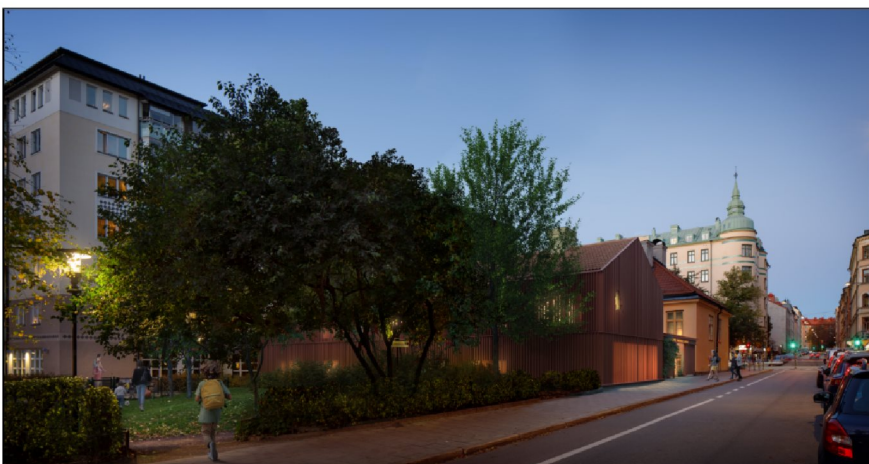
Perspektiv från Surbrunnsgatan. Illustration: Winroth Arkitekter

Mot Surbrunnsgatan och innergården ges fasaden en mer öppen karaktär med större fönsterpartier för att förmedla den publika karaktären. I bottenvåningen etableras en restaurang som även bereds uteservering på gården. I övriga delen av byggnaden inryms hotellrum.