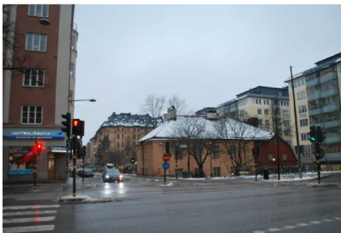
Huvudbyggnaden från år 1742 inom Claes På Hörnet är nedsänkt i terrängen mot Birger Jarlsgatan.

Claes På Hörnet är uppkallat efter Claes Browall som år 1731 köpte malmgården i hörnet Surbrunnsgatan - Roslagsgatan, där han öppnade vårdshuset Browallshof. Byggnaderna från den ursprungliga malmgården revs och ersattes år 1784 av den putsade byggnad vi ser idag.