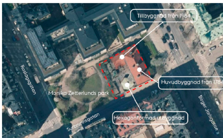
Flygfoto med fastigheten Claes på Hörnet med omgivning.

Omgivningen består av klassiska stenstadskvarter anlagda enligt rutnätsmönster, uppförda i huvudsak under det sena 1800-talet och tidiga 1900-talet. I närmiljön finns enstaka inslag av bebyggelse från 1900-talets mitt, integrerade i den äldre kvartersstrukturen.