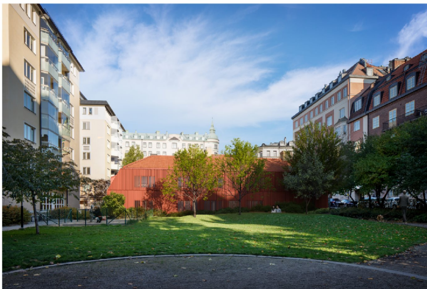
Perspektiv från Monica Zetterlunds Park. Flygelbyggnadens fasad utformas med faluröd träpanel med utanpåliggande träribbor. Mot marken löper träribborna även över fönstren i syfte att mildra dess närvaro. Illustration: Winroth Arkitekter

Monica Zetterlunds Park löper träribborna även över fönstren i syfte att mildra dess närvaro i parken och fungerar även som ett visst insynsskydd. Fönstren delas in för att skapa en småskalig karaktär och harmoniera med de utanpåliggande träribborna. Mot parken avfärgas fönstren med faluröd slamfärg och mot gården med ockragul kulör som knyter an till huvudbyggnaden.