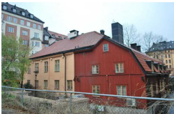
Fasaden mot Birger Jarlsgatan som utgörs av de två sammanfogade byggnadskropparna, den putsade byggnaden från 1700-talet och den rekonstruerade byggnaden från 1980-talet.

År 1984 revs timmerhusbyggnaden som var i dåligt skick, vid en omfattande ombyggnad. Den ersattes med en rekonstruerad byggnad med ett 1700-talsuttryck, med brutet tak och rödfärgad träpanel.