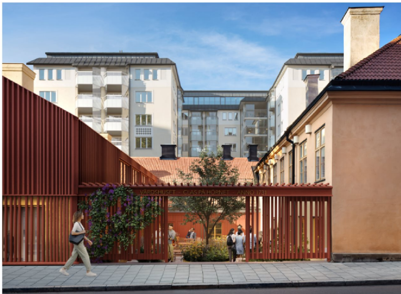
Perspektiv från Surbrunnsgatan. Entréportalen utförs med vertikala träribbor som ansluter till byggnadens fasad. Illustration: Winroth Arkitekter

Mot Surbrunnsgatan uppförs en entréportal till innergården. Portalen utförs med vertikala träribbor som ansluter till byggnadens fasad. Gården ligger på en ursprunglig och lägre nivå än omgivande gator och en trappa med ramp och hiss överbryggar höjdskillnaden.