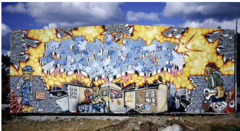
Bild ur åtgärdsprogrammet för målningen (2015). Fotografiet är taget av Circle 1989 när målningen var färdigställd.