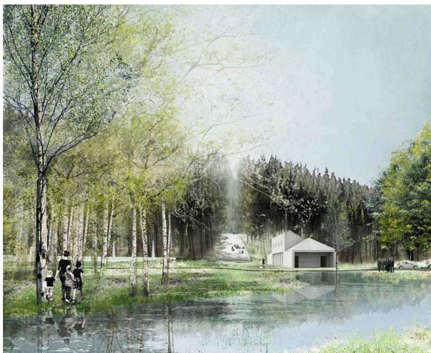
Illustration på del av våtmarksparken och ceremonibyggnaden i etapp 1 ur gestaltungsprogrammet.

Områdets landskapskaraktär ska bibehållas och förstärkas där det behövs. Mindre nyplanteringar kan bli aktuella inom de nya gravkvarteren för att i vissa fall intimisera landskapets skala. Det kan bli aktuellt att öppna upp vissa landskapsrum, liksom förtäta andra med ny vegetation. Våtmarksområdet i södra planområdet kommer att restaureras och utvidgas och bli till en våtmarkspark.