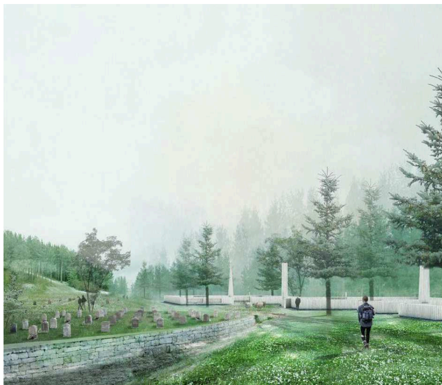
Illustration på gravöarna och landskapet ur gestaltningsprogrammet. Till vänster illustreras ett steninklätt s.k. ha-ha dike och till höger ett staket i trä. Mellan dessa gravöar ska ytorna vara tillgängliga för rekreation.