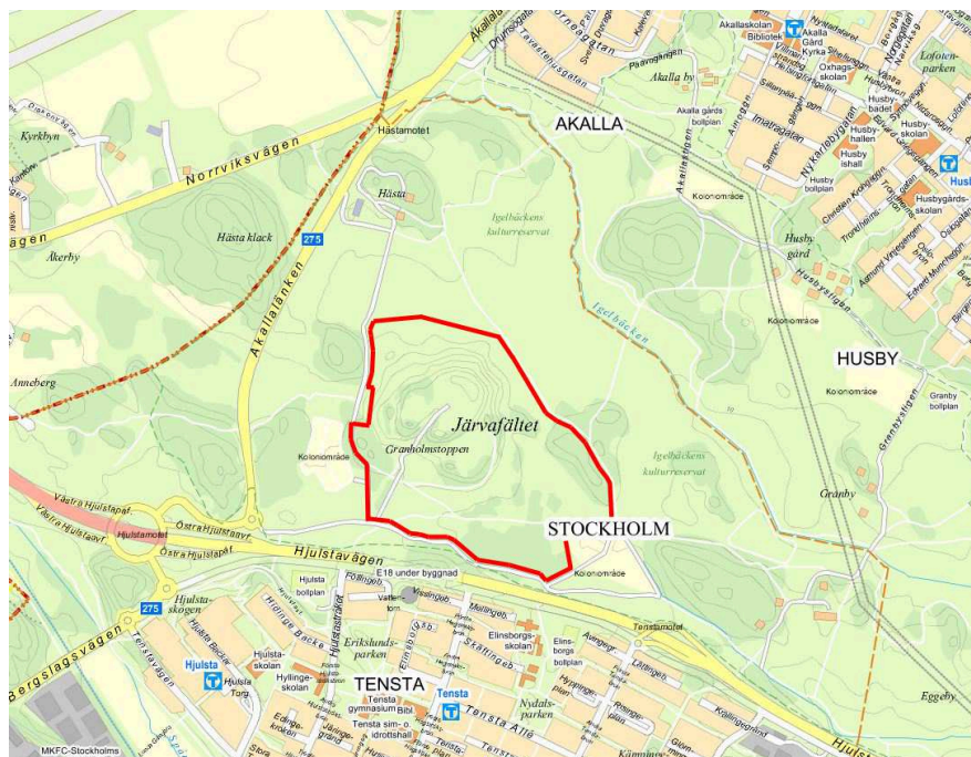
Planområdets ungefärliga läge markerat i rött.