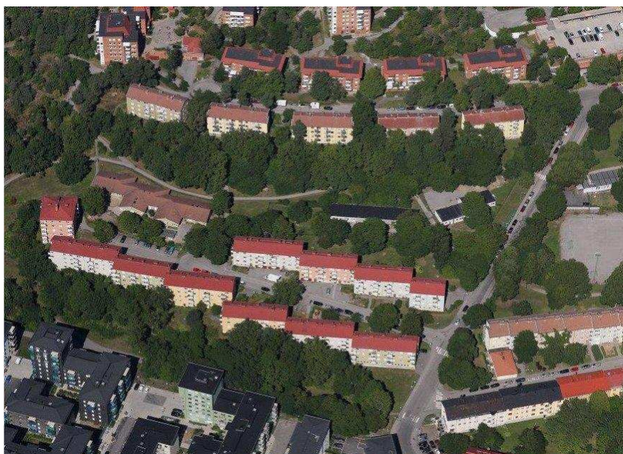
Flygperspektiv över området

En gång- och cykelväg, Hövdingastigen, leder genom parkområdet i öst-västlig riktning.