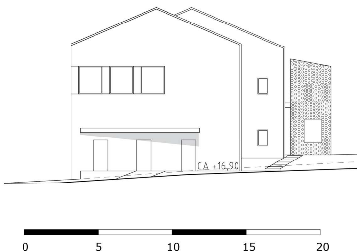
Fasadskiss, vy mot östra fasaden samt angöring från Stenkilsgatan