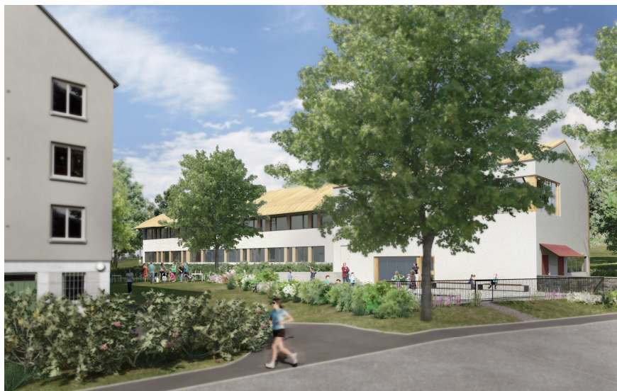
Perspektivbild, sett från sydost, Stenkilsgatan.

I förslaget redovisas friytor om 17,7 m 2 /barn, vilket överstiger stadsdelens målsättning (15 m 2 /barn). Fastighetens exakta utsträckning bör dock bestämmas i samråd med landskapsarkitekter, liksom angöring studeras i samråd med trafikingenjörer.