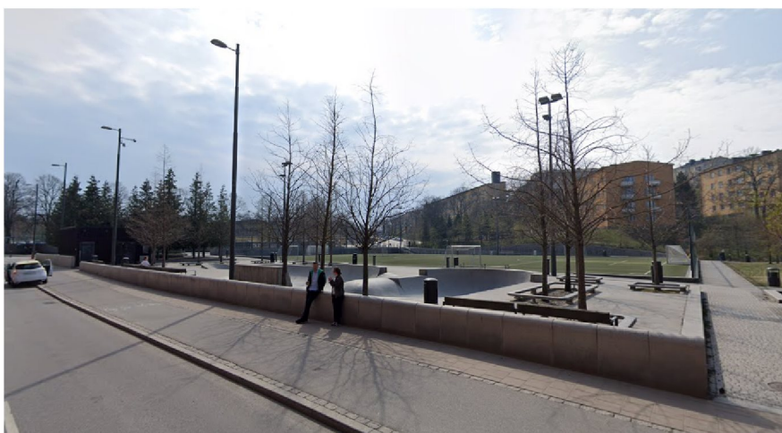
Befintlig skatepark i Kristinebergs strandpark.