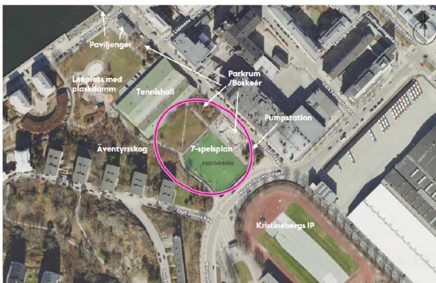
Ortofoto över Kristinebergs strandpark och dess olika delar. Lila ring markerar ungefärligt planområde.

Kristinebergs strandpark är en del av Kungsholmens grönstruktur och en mångfunktionell stadsdelspark från Ulvsundasjön till Drottningholmsvägen. Parken erbjuder många upplevelsevärden, t.ex. idrott, lek, solbad, skateåkning, promenader, pulkaåkning och grillning. Parken fungerar som en naturlig länk i Kungsholmens grönstruktur och sammanhängande promenadstråk genom sin koppling till Fredhällsparken. Den fungerar även som ett stadsbyggnadskitt mellan nordvästra Kungsholmens olika bebyggelsegrupper och stadstyper.