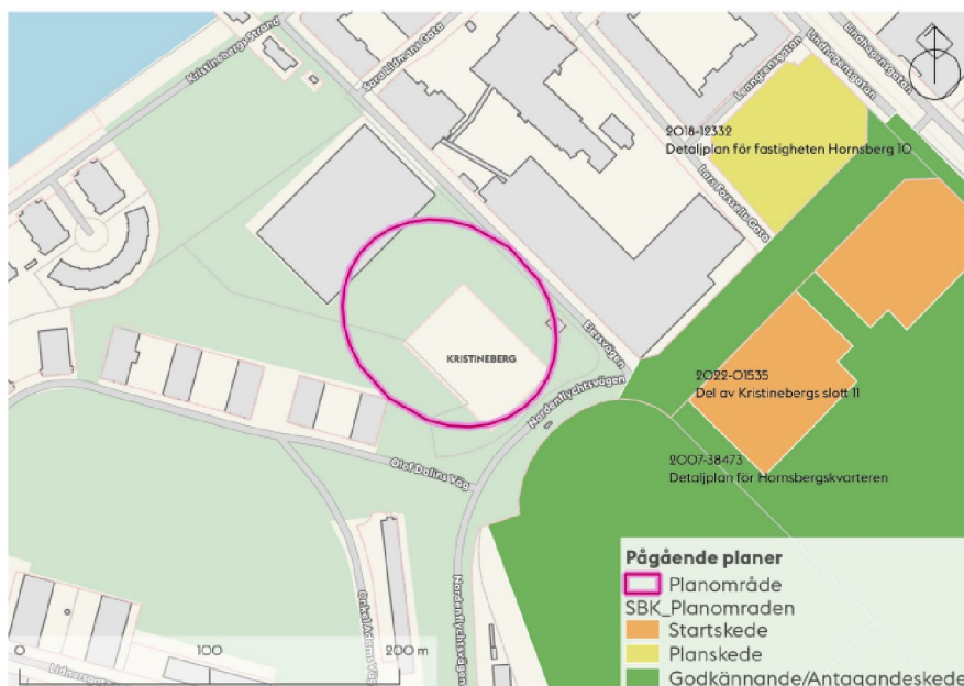
Karta som visar planområdets läge och preliminära avgränsning samt pågående detaljplaner och program i närområdet.

Planområdet berör fastigheterna Tennisbollen 1 och Kristineberg 1:1 i Kristineberg.