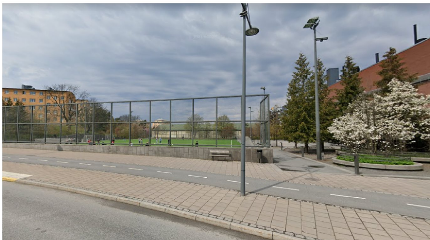
Befintlig 7-spelsplan i Kristinebergs strandpark.