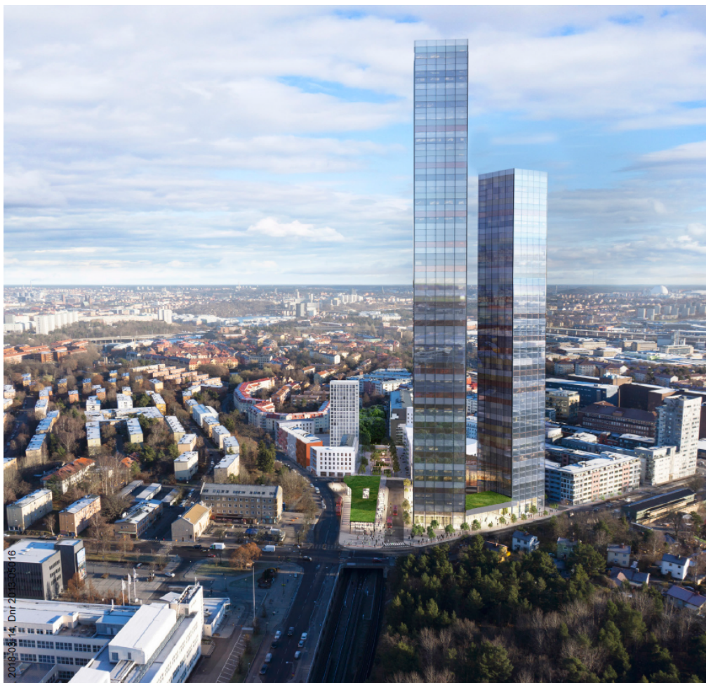
Illustration över situationsplanens föreslagna kvarter och bebyggelsevolym (sett från väster). Illustration: Wingårdhs och Varg Arkitekter.