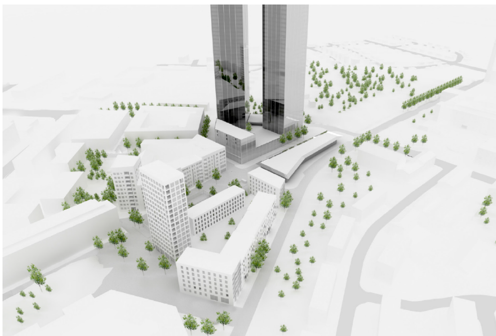
Illustration över situationsplanens föreslagna kvarter och bebyggelsevolym (sett från nordost). Illustration: Wingårdhs och Varg Arkitekter.