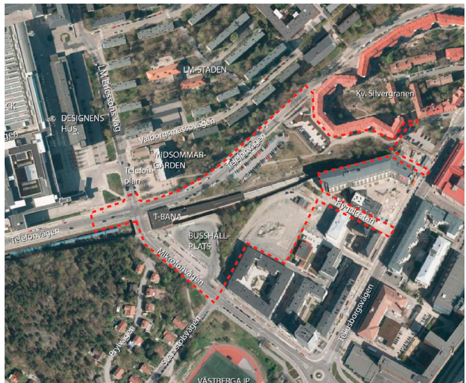
Ortofoto med preliminär avgränsning av planområdet (röd streckad linje). Tunnelbanans befintliga station ligger i korsningen Mikrofonvägen och Telefonvägen.

Förslaget syftar även till att pröva lämpligheten i att skapa ett nytt landmärke i form av två 78 respektive 58 våningar höga bostadstorn i denna del av Stockholms stad. Landmärken kan vara av symbolisk kraft. Mot bakgrund av områdets historia och kulturhistoriskt värdefulla miljöer, är ambitionen att förslaget ska bidra till Stockholms utveckling samtidigt som bebyggelsens struktur och utformning arkitektoniskt ska förvalta, förnya och förstärka identiteten i området kring Telefonplan.