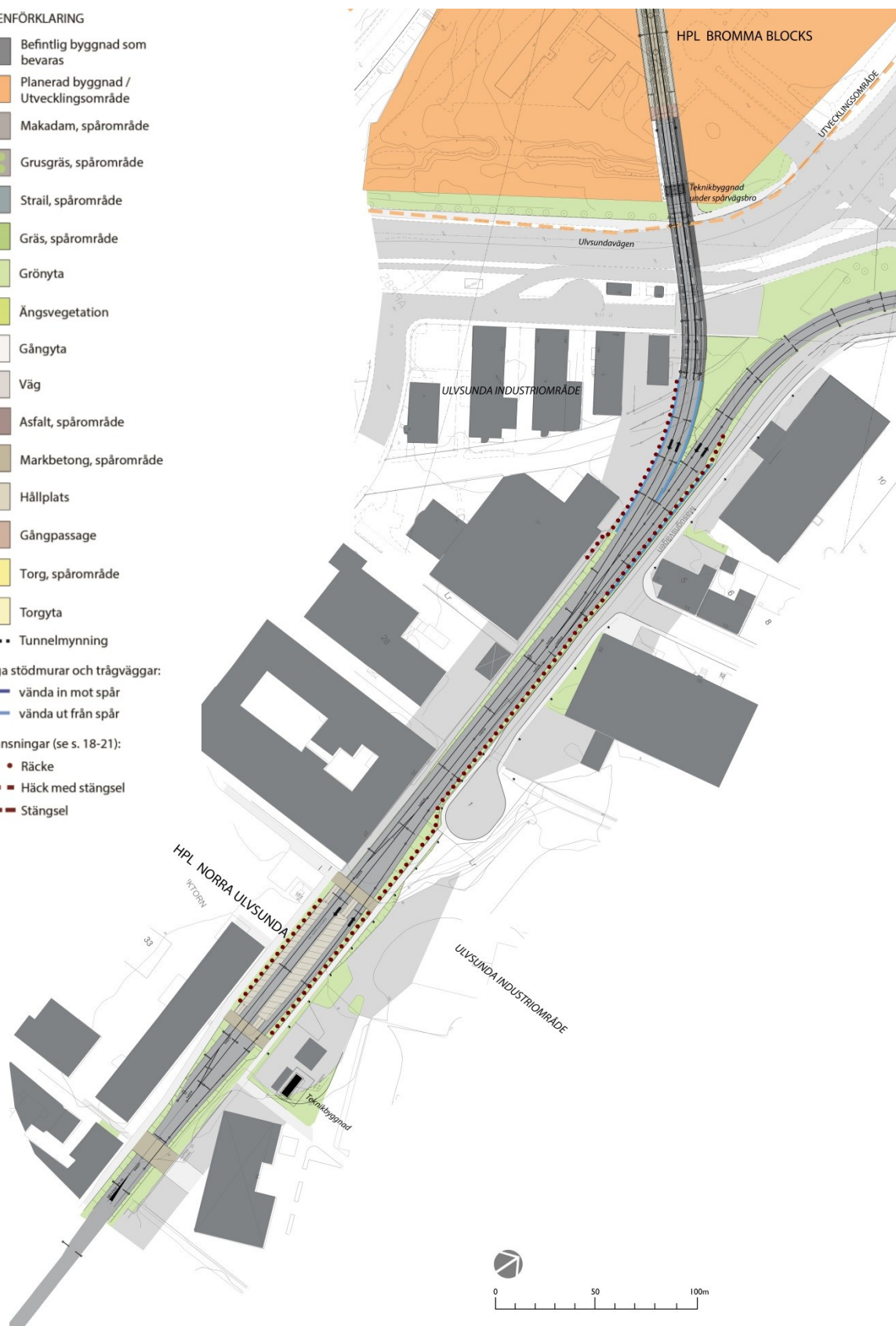
Illustration över Tvärbanan vid Ulvsunda industriområde och avgränsningen från den befintliga Solnagrenen.