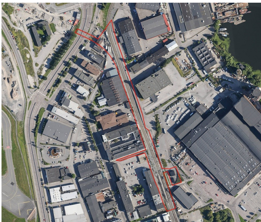
Flygbild med planområdet markerat i rött.