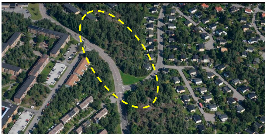
Ortofoto. Planområdet är ungefärligt markerat med streckad linje.

Planområdet ingår i ett habitatnätverk för eklevande arter. Enligt genomförd naturmiljöutredning finns fyra naturvärdesobjekt, varav två områden med påtagligt naturvärde (naturvärdesklass 3) och två områden med visst naturvärde (naturvärdesklass 4).