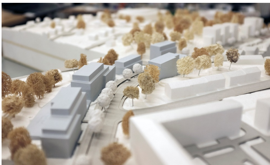
Föreslagen bebyggelse längs med Bredängsvägen. Släpp mellan hus möjliggör för inblickar mot naturmark.