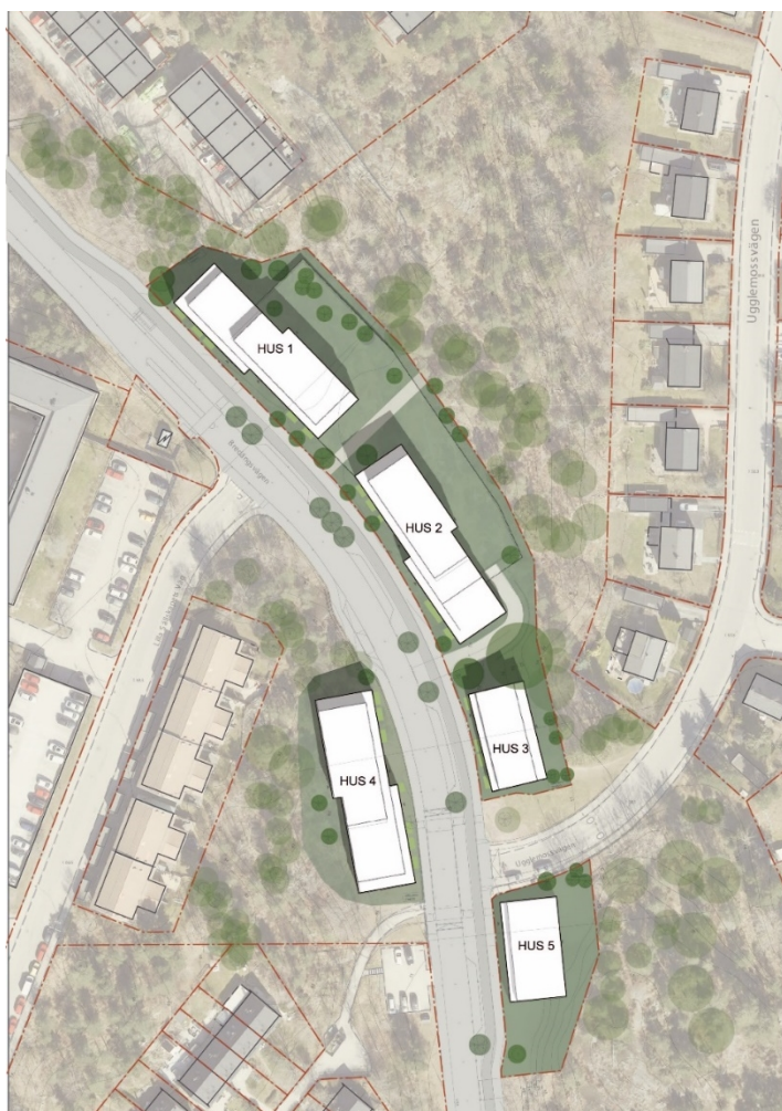
Illustrationsplan föreslagen bebyggelse omformad gata och utbredning av kvartersmark och gårdsytor, stadsbyggnadskontoret

Byggnaderna har en smal förgårdsmark mot gatan. Huvudentréer placeras mot gatan. Entrépartierna utformas för att markera sig i fasaden. Mot bostadsgårdarna och naturmarken finns mindre entréer, privata uteplatser och utkragande balkonger. Husen får enhetliga fasader mot gatan, beklädda med ett tegelmateriäl. Varje hus ges en egen kulör som ger de enskilda husen sin egen karaktär som harmonierar sinsemellan. Parkering för bil anordnas i underbyggt garage med infart från Bredängsvägen. Garaget anpassas till befintlig terräng för att möjliggöra en användbar gårdsyta. Infarten till garaget sker genom en ramp från Bredängsvägen. Höjdskillnaden hanteras med stödmurar om maximalt 4 meters höjd.