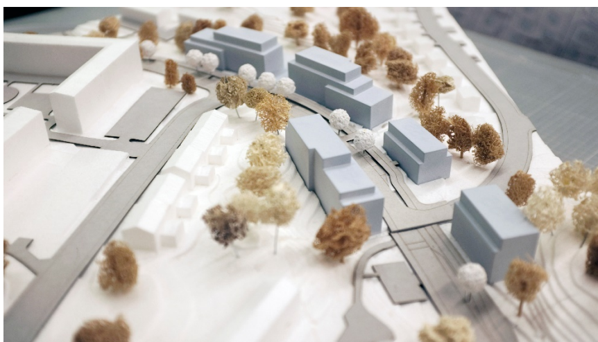
Föreslagen bebyggelse följer Bredängsvägens svängda form. Ett gemensamt karaktärsdrag är från gatan tydligt indragna övre våningar.