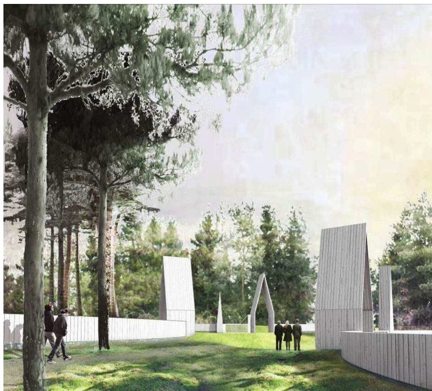
Illustration på entrébyggnaderna till gravöarna ur gestaltningssprogrammet.

Varje begravningsö utgörs av ett kvarter med en tydlig avgränsning som kan vara ett steninklätt så kallat ha-ha dike, vilket är ett lågt dike i terrängen vars insida förstärks med träinkladd sten, ett staket i trä eller stenformationer i landskapet. Öarna ska ha tydliga entréer som utgör skarpa distinktioner mellan upplevelsen av att röra sig inne i begravningskvarteret eller ute i det omkringliggande rekreativa landskapet.