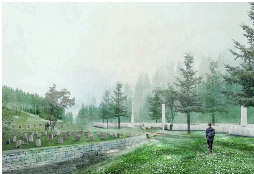
Illustration på gravöarna och landskapet ur gestaltningsprogrammet. Till vänster illustreras ett steninklätt s.k. ha-ha dike och till höger ett staket i trä. Mellan dessa gravöar ska ytorna vara tillgängliga för rekreation.

Alla begravningsplatser anläggs som enskilda begravningsöar i landskapet. Landskapet mellan öarna ska vara tillgängligt för alla.