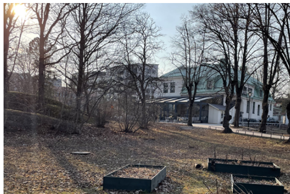
Läkarvillan 1. Bild till vänster: Långbro vårdshus från söder. Bild till höger: Samma byggnad sedd från Stora Mans väg.