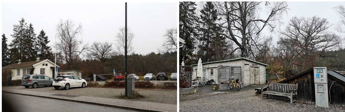
Lågbron 1. Bild till vänster: grusad markparkering inom fastigheten. På platsen fanns tidigare växthus som brann ner under 2000-talet. Bild till höger: förrådsbyggnad och jordkällare inom fastigheten.

Inom fastigheten finns idag ett enplanshus, en förrådsbyggnad och markparkering. Byggnaderna har under delar av Långbro sjukhus verksamhetstid haft en funktion som trädgårdsmästeri. Idag innehåller byggnaderna caféverksamhet. I fastighetens södra del fanns tidigare växthus. Dessa brann ner under 2000-talet och ersattes av markparkering.