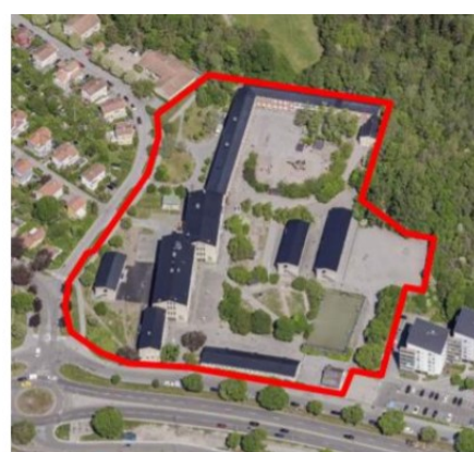
Planområdet och dess närområde i plan och i flygbild. Planområdet är markerat med röd linje.