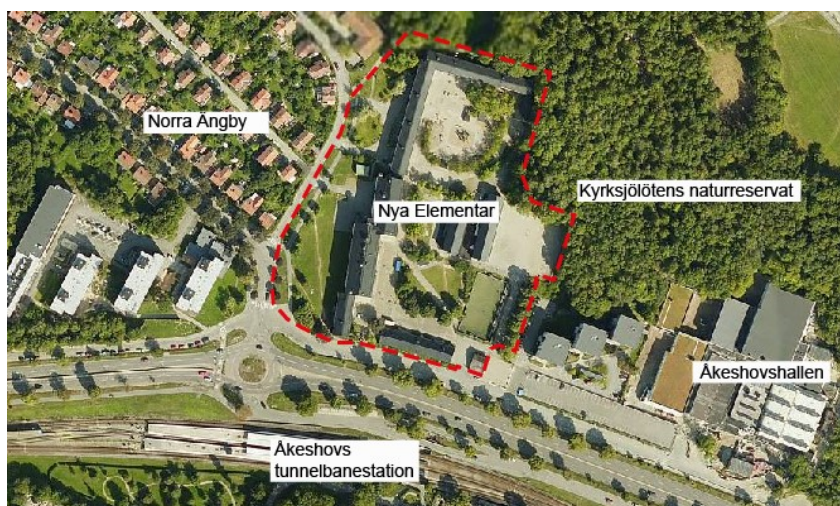
Flygfoto som visar planområdet i streckad röd linje och närmsta omgivning.