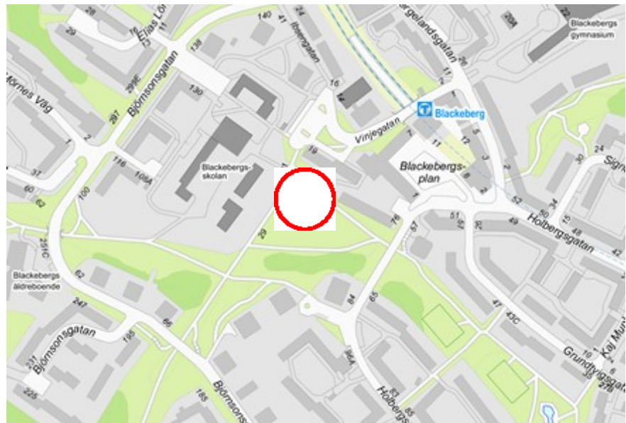
Översiktsbild med föreslaget planområde markerat i rött.

Planområdet ligger i Blackeberg invid Blackebergsstråket strax över 100 meter från Blackebergs tunnelbanestation. Området omfattar ca 2 100 m 2 .