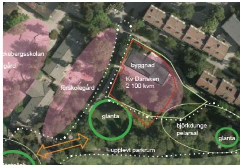
Befintlig fastighetsgräns i rött. Förslag till ny fastighetsgräns i gult. (2018-11-14)

Blackebergsstråket. De nya fastighetsgränserna ska ta hänsyn till och beakta gläntorna och andra värden i parkmiljön.