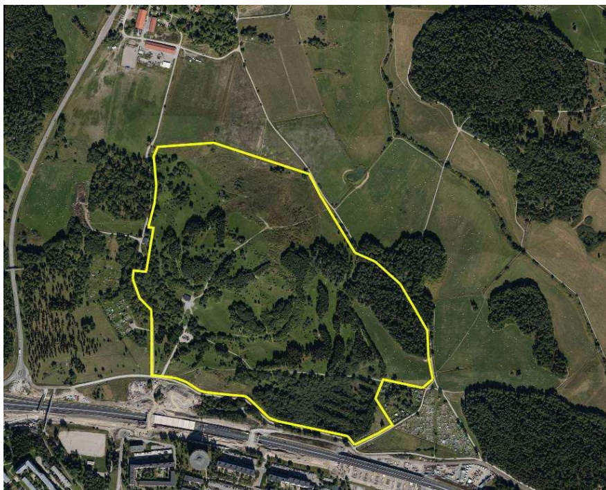
Planområdet markerat i gult.

Hela planområdet ingår i Igelbäckens kulturresevat. Syftet med resevatet är bland annat att säkra och utveckla ett stort och viktigt grönområde till ett aktivitetsfält för rekreation, friluftsliv, kulturell upplevelse, naturupplevelser, pedagogik, spontanidrott och socialt umgänge för de många människor som bor i närområdet samt för andra stockholmare.