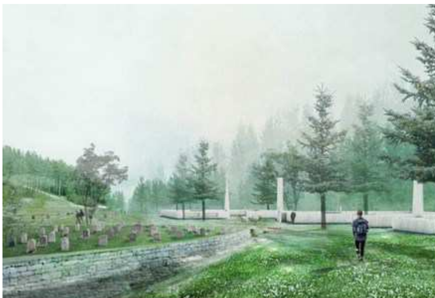
Illustration ur gestaltningsprogrammet på gravöarna och landskapet. Till vänster illustreras ett steninklätt s.k. ha-ha dike och till höger ett staket i trä. Mellan dessa gravöar ska ytorna vara tillgängliga för rekreation.

Alla gravområden anläggs som enskilda begravningsöar i landskapet. Landskapet mellan öarna ska vara tillgängligt för alla.