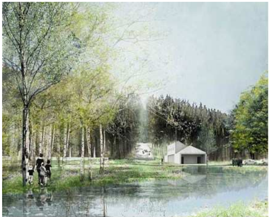
Illustration ur gestaltungsprogrammet på del av våtmarksparken och ceremonibyggnaden i etapp 1.

Områdets landskapskaraktär ska bibehållas och förstärkas där det behövs. Mindre nyplanteringar kan bli aktuella inom de nya gravkvarteren för att i vissa fall intimisera landskapets skala. Det kan bli aktuellt att öppna upp vissa landskapsrum, liksom förtäta andra med ny vegetation. Våtmarksområdet i södra delen av planområdet kommer att restaureras, utvidgas och bli till en våtmarkspark.