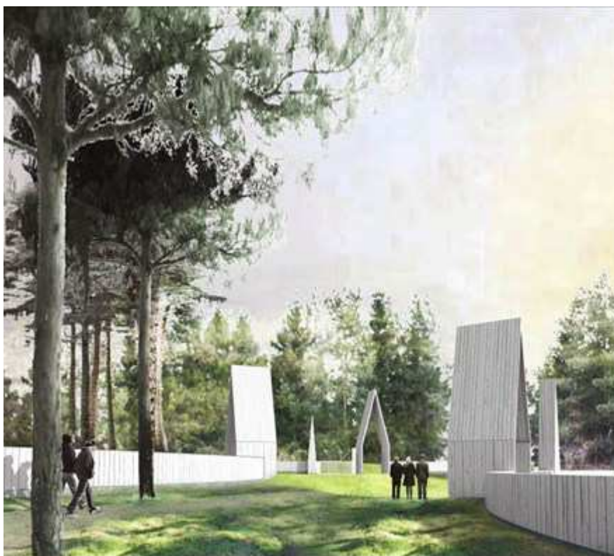
Illustration ur gestaltningsprogrammet på entrébyggnaderna till gravöarna.