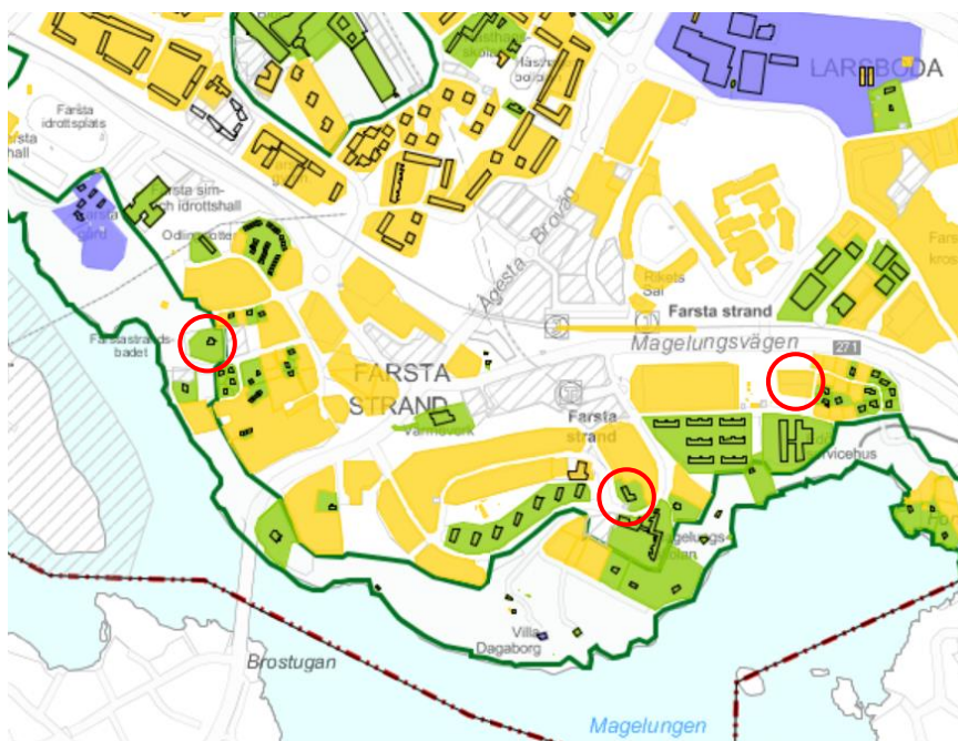
Karta över Stadsmuseets kulturhistoriska klassificering i Farsta Strand. Planområdena markerat i rött.

Fastigheterna Risselö 2 och Tornö 2 är enligt Stadsmuseets kulturhistoriska klassificering grönklassade. Grön klassning är den näst högsta klassen, och betyder att bebyggelsen är särskilt värdefull från historisk, kulturhistorisk, miljömässig eller konstnärlig synpunkt. Kapellskär 1 är gulklassificerad. Gult är den tredje nivån och innebär att en fastighet har bebyggelse av positiv betydelse för stadsbilden och/eller av visst kulturhistoriskt värde.