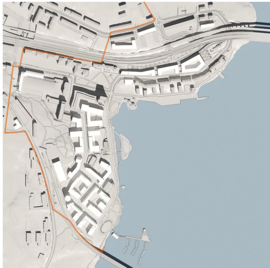
21 juni kl 12