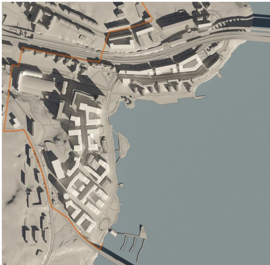
20 mars kl 9