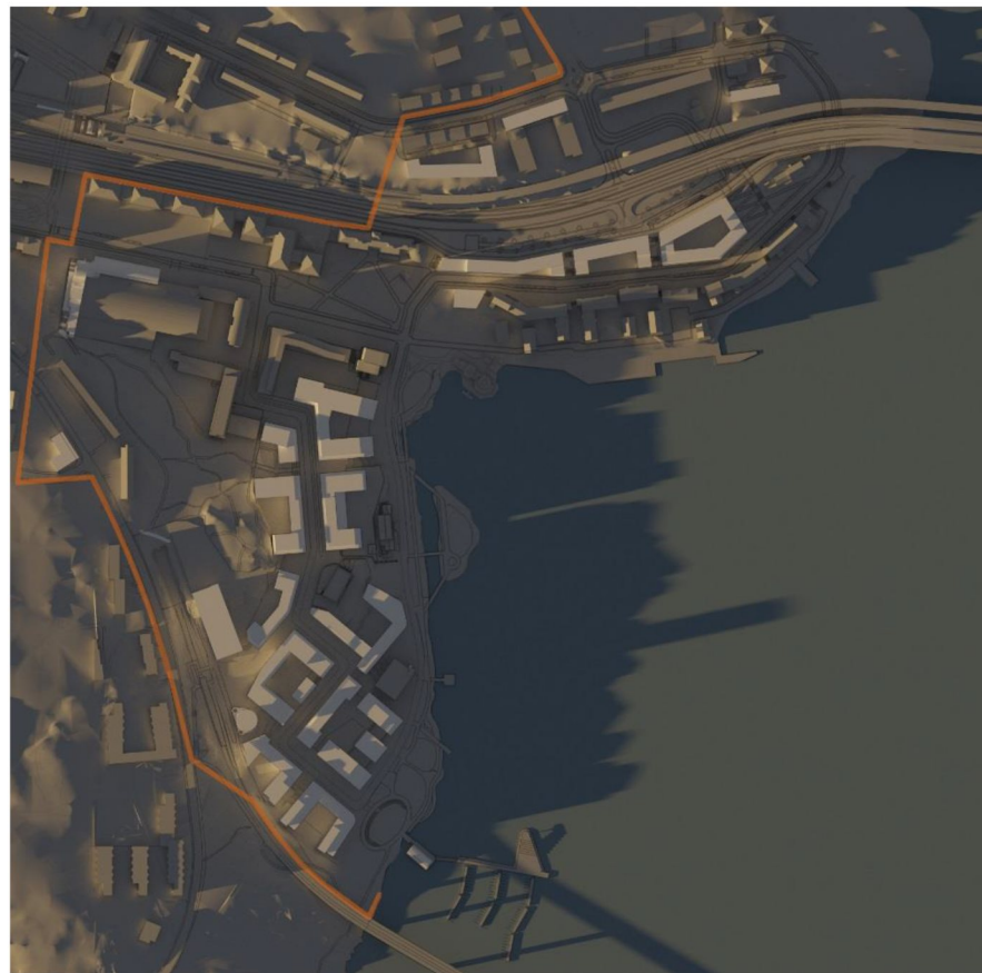
20 mars kl 17