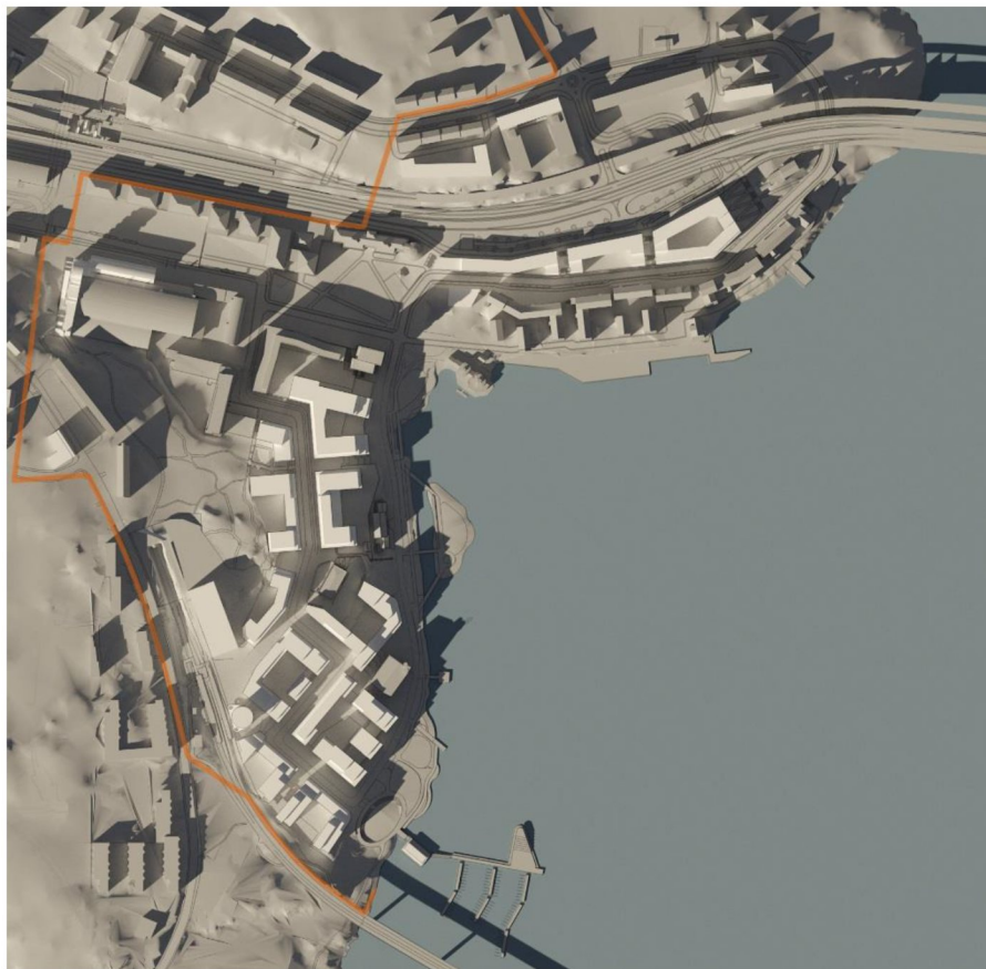
20 mars kl 15