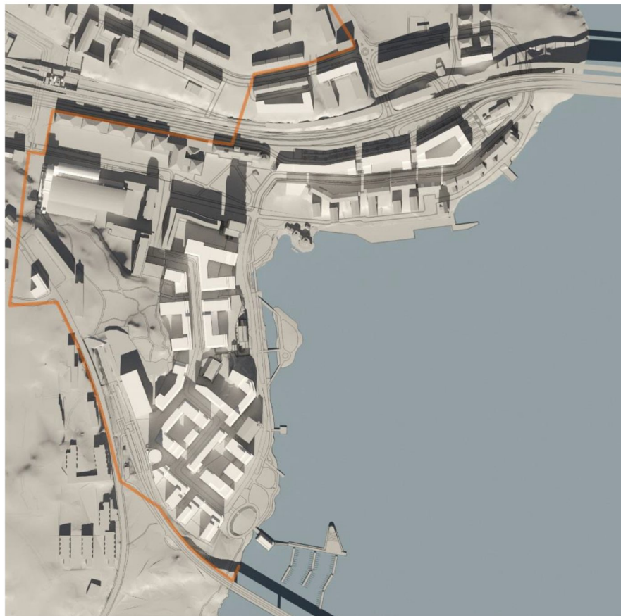
20 mars kl 12