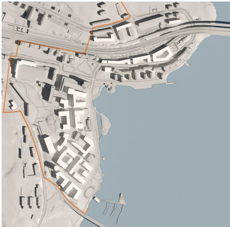
21 juni kl 9