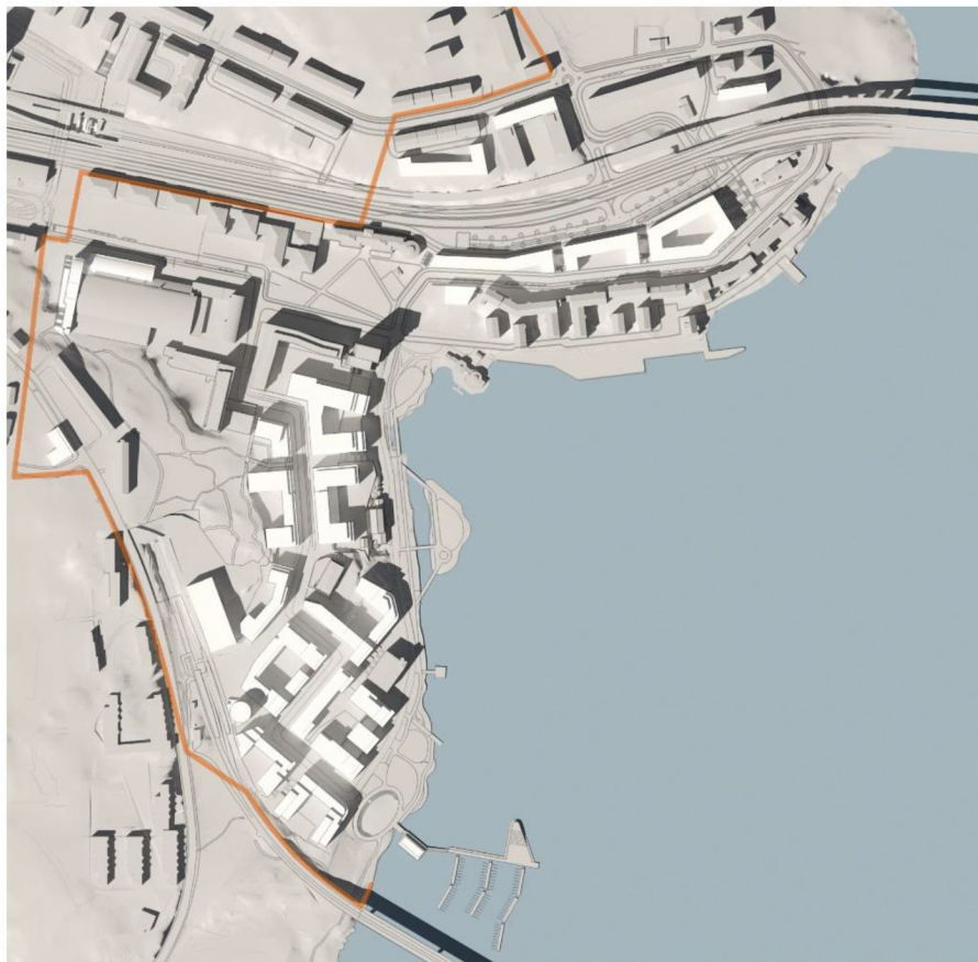
21 juni kl 15