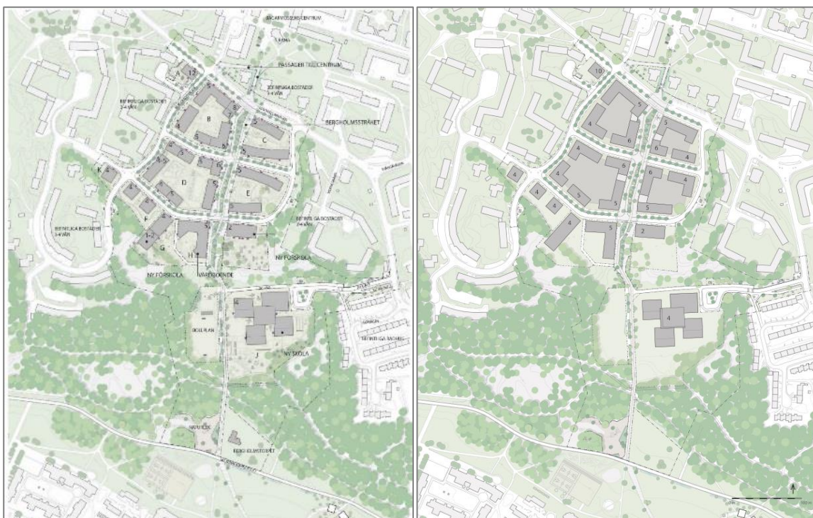
Strukturplan från samrådsförslaget

Med anledning av de synpunkter som framförts under samrådet har kontoret justerat förslaget för att uppnå en tydligare struktur och en mer sammanhängande gestaltning av bebyggelse med fokus på utformning av kopplingen mellan Bagarmossen och Skarpnäck. Bergholmstråkets sträckning är en viktig del av planens syfte och föreslås inte ändras. De föreslagna byggnadshöjderna bedöms vara välavvägda med hänsyn till omgivningen. Det höga huset föreslås sänkas till cirka tio våningar för att harmoniera med de befintliga höga husen i Bagarmossen.