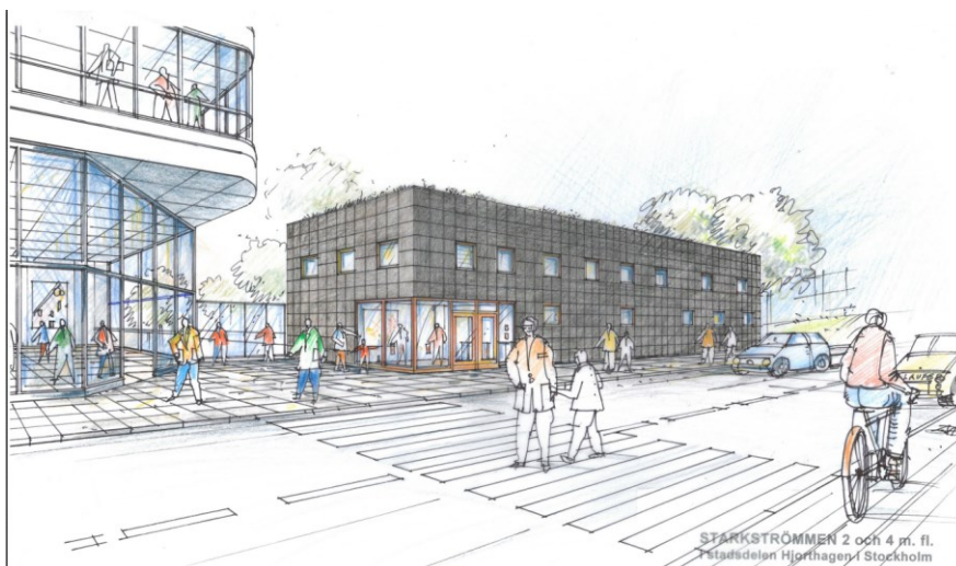
Illustration: Den nya driftdepån med fasad och uppglasad entré mot Jägmästargatan. (SWECO)

Driftdepåns fasad sluter upp mot Jägmästargatan. Fasaderna ges en industriell karaktär och föreslås uppföras i brun/svart cortenstål. Entrépartiet glasas upp mot den entréplats som bildas mot Jägmästargatan. Byggnaden föreslås få sedumtak.