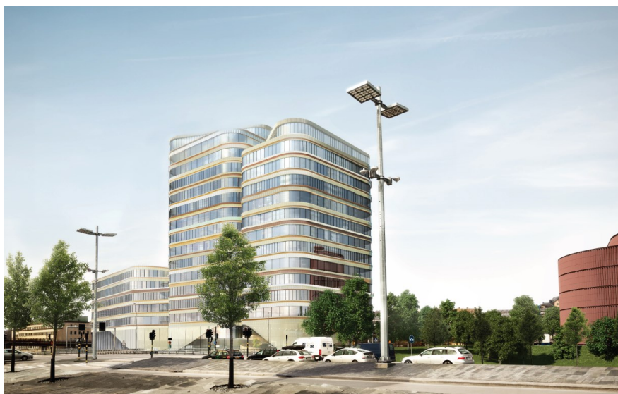
Illustration: Det nya kontorshuset. (Tengbom Arkitekter)

Byggnadens totalhöjd kommer begränsas i enlighet med Försvarmaktens yttrande. I övrigt föreslår kontoret att byggnadens volym i huvudsak behålls under förutsättning att riskreducerande åtgärder inte behöver vidtas som kan komma att påverka volymen. Det föreslagna kontorshusets utformning och volym passar väl in i den storskaliga miljön vid Norra länken. Gestaltningen ligger i linje med kontorets syn på vikten av urskiljbara byggnadsvolymer och en inbjudande och levande fasad mot Jägmästargatan. Gestaltungsförslaget kan därför ligga till grund för fortsatta diskussioner med Vasakronan. Ett par bestämmelser föreslås på plankartan som säkerställer byggnadens tre-delning, varierade höjder, fasadens horisontella uppdelning samt materialval.