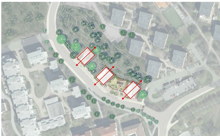
Illustration som visar ett exempel på hur riktningen kan ändras. Bild: SBK med underlag från AML arkitekter.

Gestaltningen av bebyggelsen och husens riktning ska studeras vidare. Enligt Stockholmsprincipen bör punkthus inom en grupp ha en enhetlig riktning snarare än att följa gatustrukturen. Möjligheten att tillämpa detta i förslaget ska utredas, utan att det medför ytterligare påverkan på naturmiljön jämfört med samrådsförslaget. Riktningen ska även stärka kopplingen till Älvsjö och stödja den stadsutveckling som planeras där. Gestaltningen av husen ska också studeras för att bättre anpassas till Solbergas karaktär. Det som avses är fasadutformning, materialval, kulörer samt placering och utformning av fönster och balkonger, så att byggnaderna samspelar med områdets befintliga uttryck.