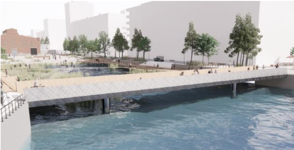
Figur 5. Vy över Silverbron från arbetsmodell, Karavans programhandling, 2023

En annan konkret åtgärd som pedagogerna lyfter som viktigt för att maximera barnens upplevelse av vattnet är att utforma ur ett barns perspektiv. I praktiken kan det exempelvis handla om titthål och andra marknära upplevelser. Ett exempel från programhandlingen är den gång- och cykelbro, Silverbron, som planeras framför Marinparken. Enligt förslaget är den utformad med solida sidoväggar om 1,30 meter, vilket gör att barn som är kortare än 1,30 meter inte kan se vattnet när de går över bron. För en mer attraktiv och barnvänlig plats föreslås att titthål öppnas upp i brons sidoväggar.