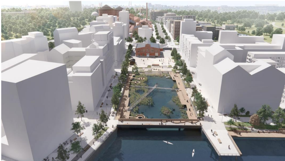
Figur 4. Flygvy från arbetsmodell över Vattengastorget och Marinparken, Karavans programhandling, 2023

Vattengastorget och Marinparken ämnar bli Kolkajens mest centrala mötesplats. Vattengastorget utformas runt det bevarade och upprustade Vattengasverket för möjligheten att integrera platsens kulturhistoriska betydelse och identitet.