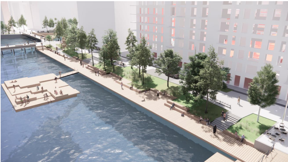
Figur 3. Vy från arbetsmodell över Norra strandpromenaden, Karavans programhandling, 2023