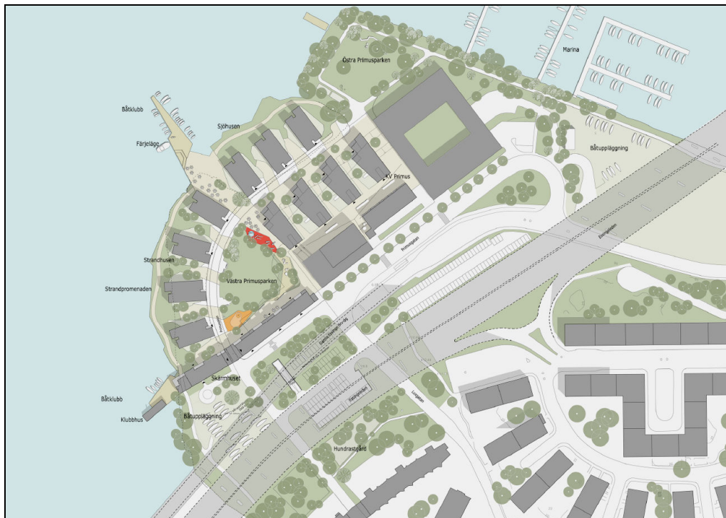
Reviderad situationsplan – Illustration Arkitema

Viktiga frågor i planarbetet och utvecklingen av fastigheten för Vasakronan vad gäller bibehållna kontorsbyggnader är bl a angöring och entréer till kontorsbyggnaderna och garageplanen som kommer att behöva omarbetas när