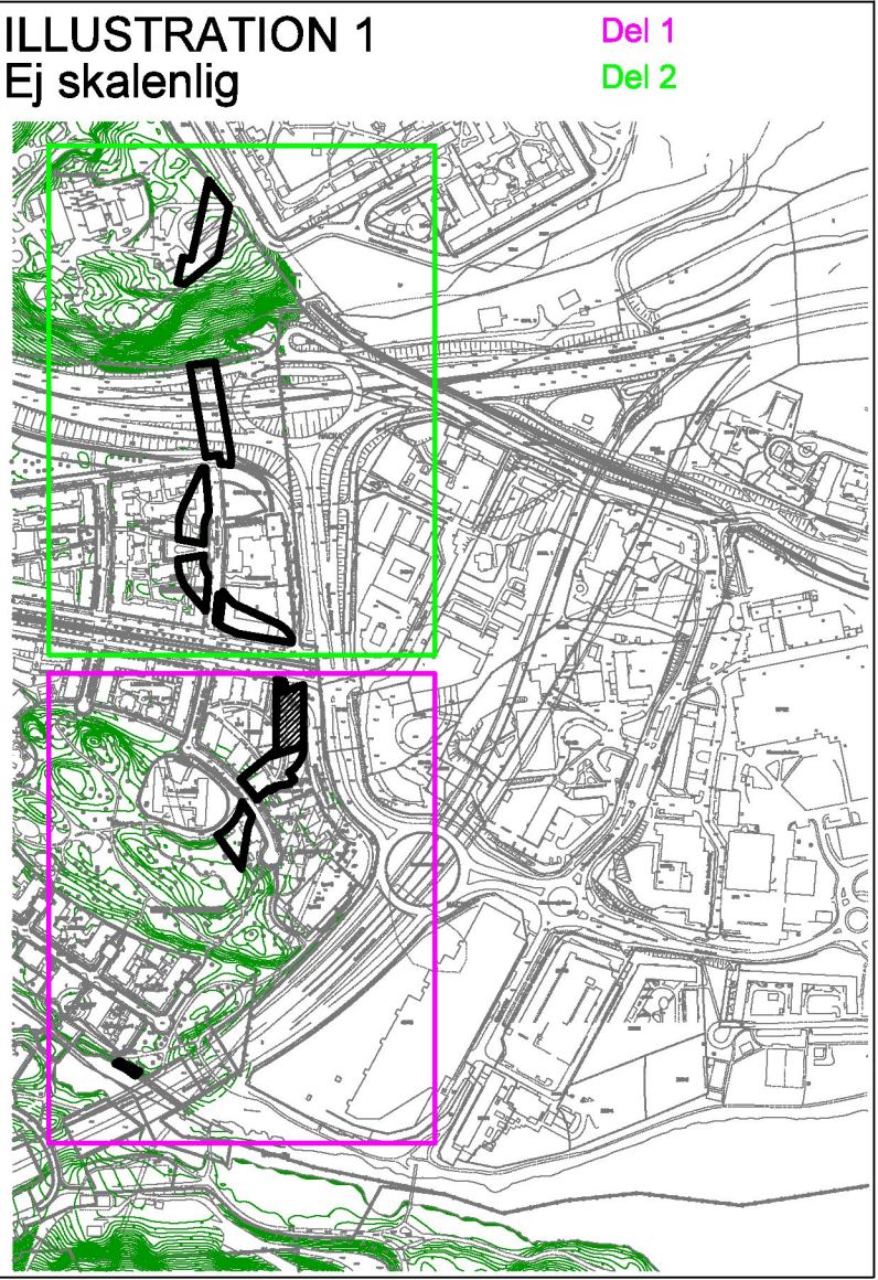
Illustration 1 visar de två planområdena på baskartan. Del 1 med rosa ram och del 2 med grön ram.