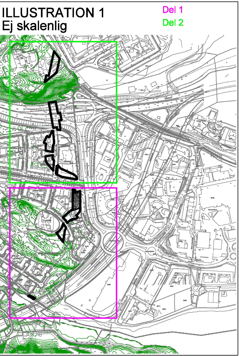
Illustration 1 visar planområdet på baskartan. Del 1 med rosa ram och del 2 med grön ram.