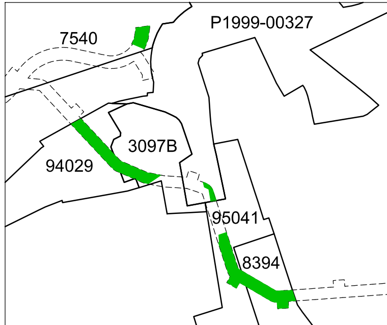
Angivna detaljplaner som berörs av ÄDp Eolshäll till Sickla, del 8. Ändring under mark görs inom de grönmärkade områdena. Ändring görs endast på kvartersmark.