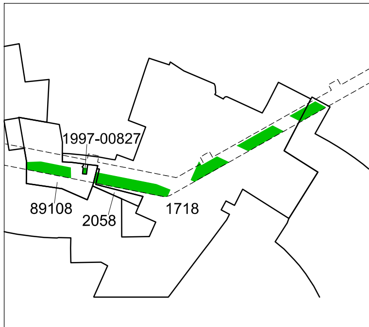
Angivna detaljplaner som berörs av ADp Eolshäll till Sickla, del 10. Ändring under mark görs inom de grönmärkade områdena. Ändring görs endast på kvartersmark.