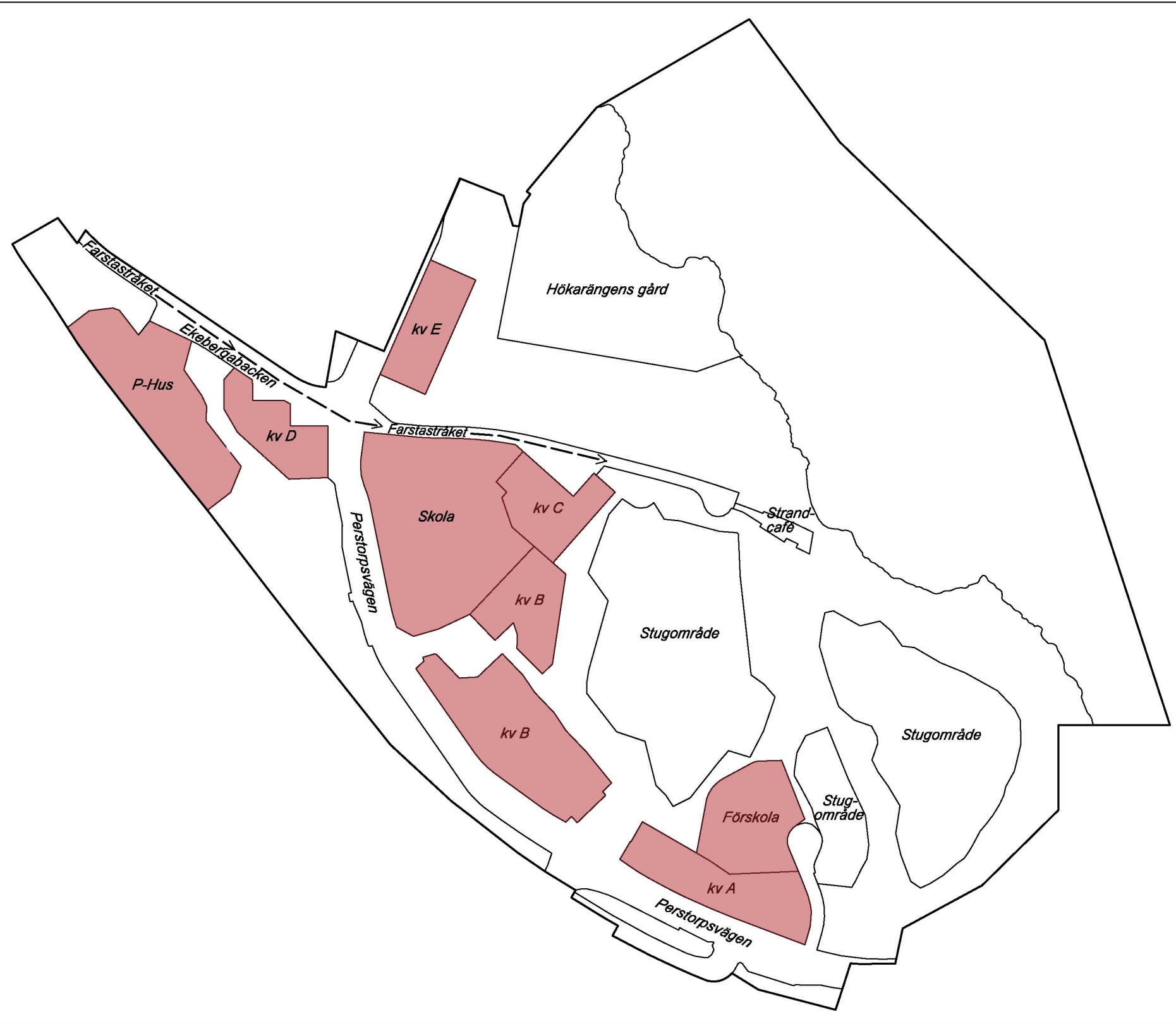
Illustration 2. Visar rödmarkerade kvarter vilka berörs av de generella gestaltungsprinciperna. Illustrationen visar också kvarteren såsom kv A, gator, skolor, förskolor, parkeringshus och Farstastråket.