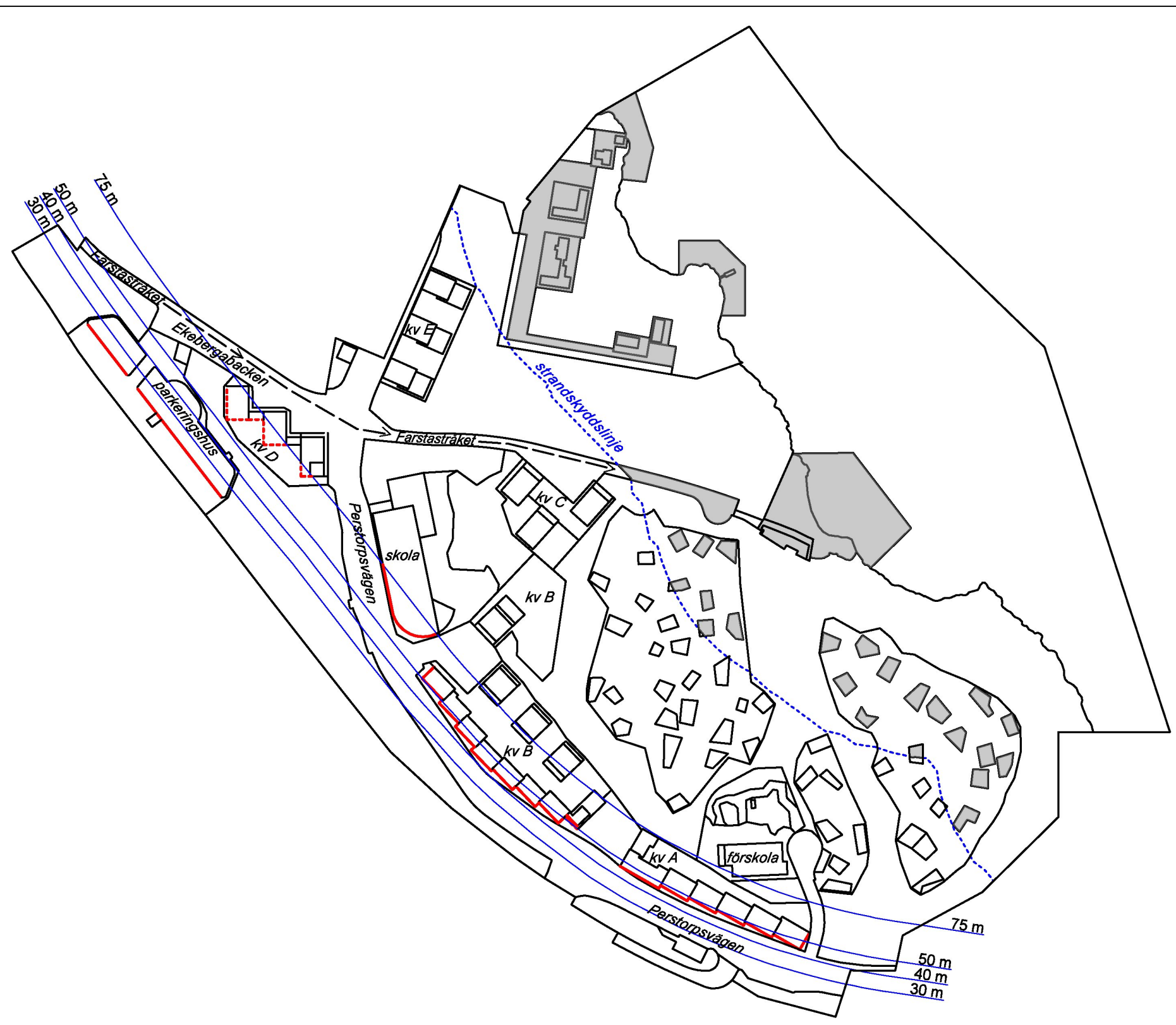
Illustration 1. Strandskyddet upphävs inom gråmarkerade områden. Fasader med röd heldragen linje omfattas i sin helhet av riskåtgärder avseende fönsterglas. Fasader med röd streckad linje som ligger över parkeringshusets nockhöjd omfattas av riskåtgärder avseende fönsterglas. Mörklila heldragna linjer markerar avståndet från Nynäsvägens körbänk.

Koordinatsystem: Sweref 99 18 00 i plan och RH2000 i höjd Upprättad av Stadsplaneringsavdelningen Aktualitetsdatum 2022-11-18 Vera Midelf Kartingenjör