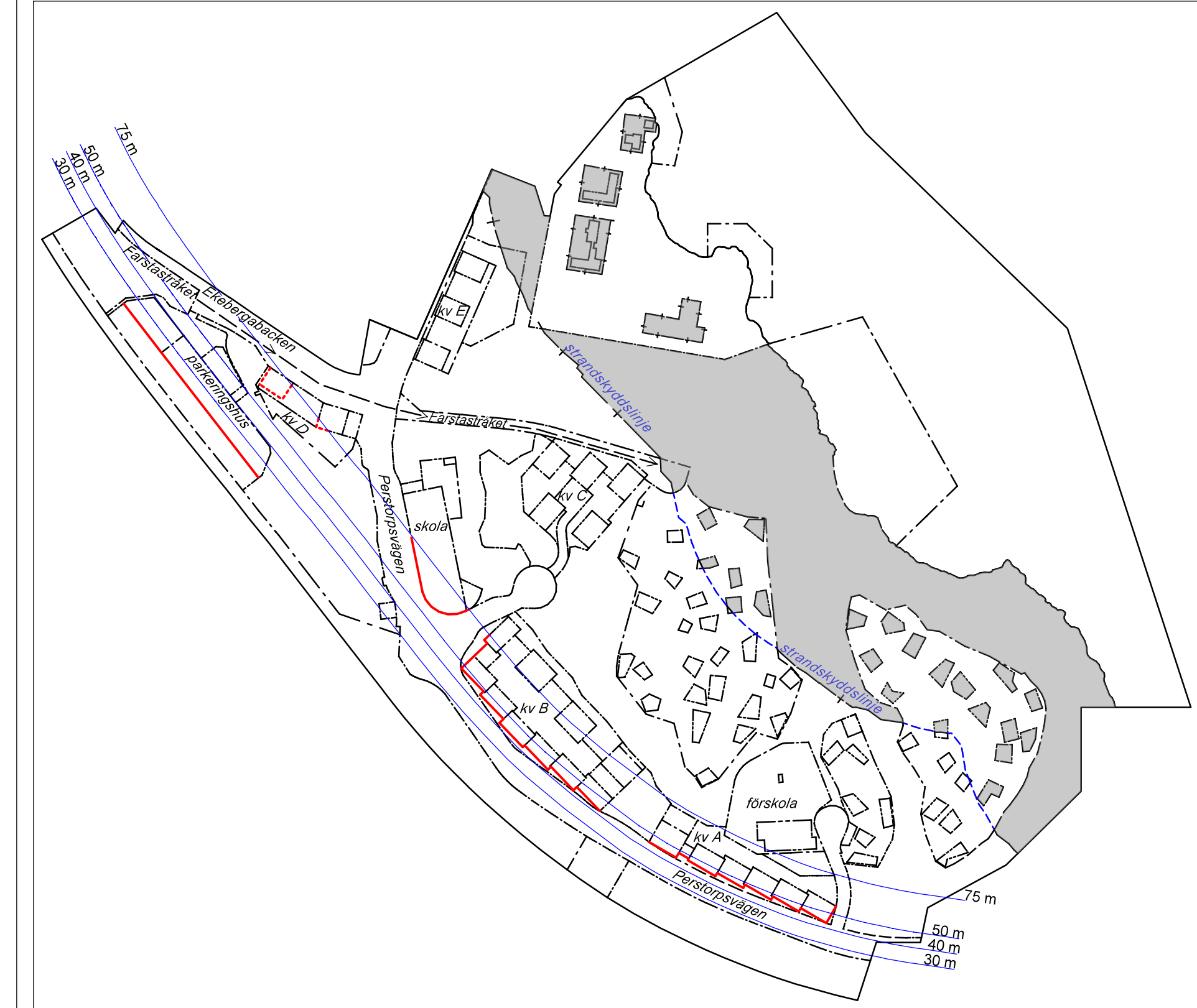
Illustration. Strandskyddet upphävs inom gränsmarkade områden. Fasader med röd heldragen linje omfattas i sin helhet av riskåtgärder avseende fönsterglas. Fasader med röd streckad linje som ligger över parkeringshusets nockhöjd omfattas av riskåtgärder avseende fönsterglas. Mörkblå heldragna linjer markerar avståndet från Nynäsvägens körbanekant. Illustrationen visar också kvarteretsmark såsom kv A, gator, skolor, förskolor, parkeringshus och Farstastråket.