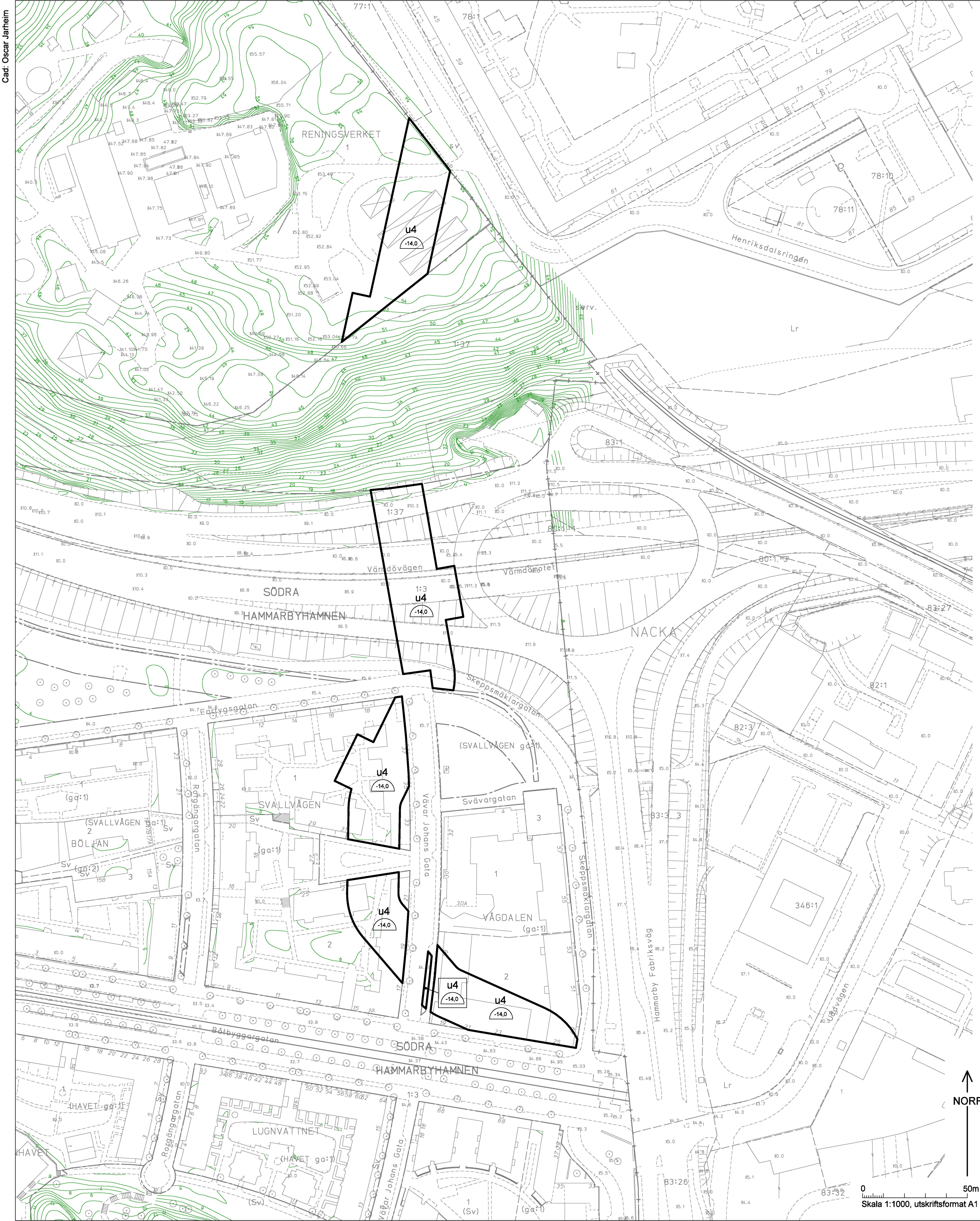
ILLUSTRATION 1 Ej skalenlig