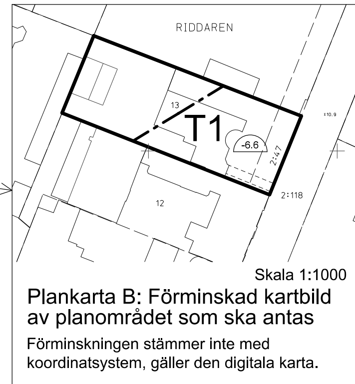
Plankarta B: Förminskad kartbild av planområdet som ska antas

Förminskningen stämmer inte med koordinatsystem, gäller den digitala karta.