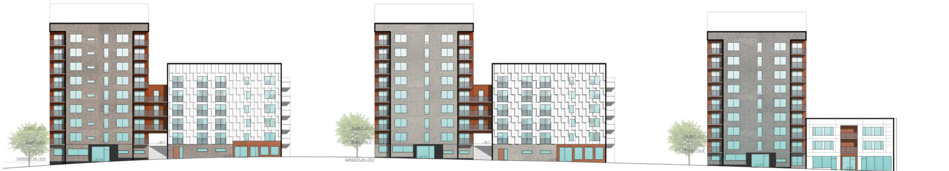
Illustrationsbild 2 - Ej skalenlig.