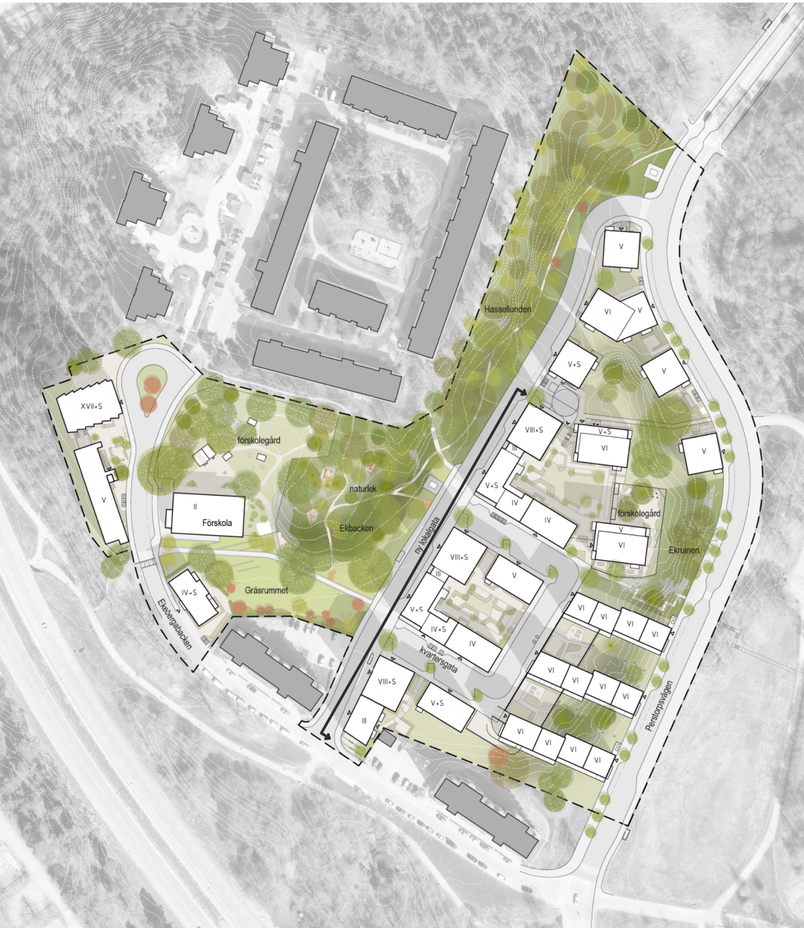
Illustrationsbild 1 - Illustrerade våningsantal. Ej skalenlig.