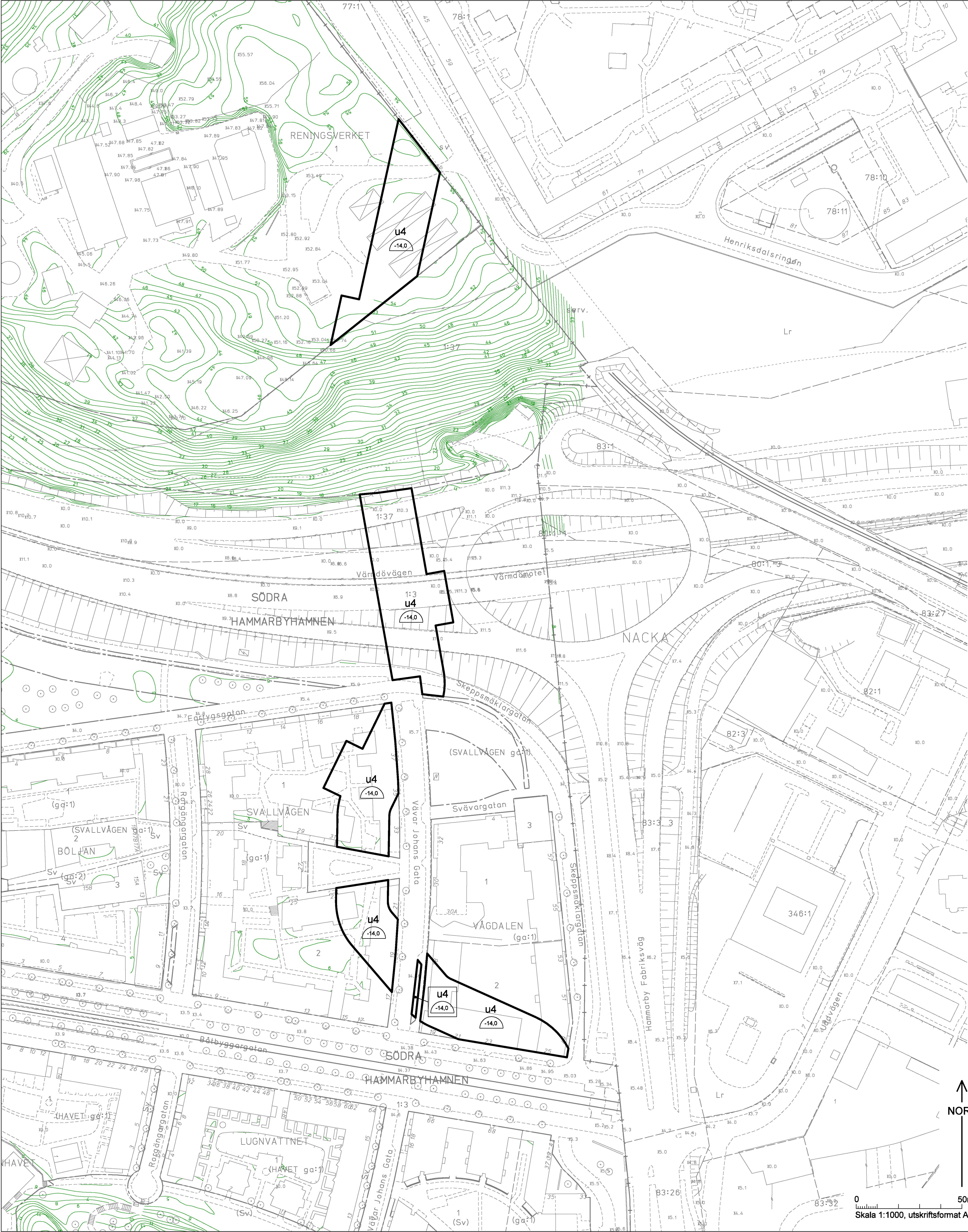
ILLUSTRATION 1 Ej skalenlig