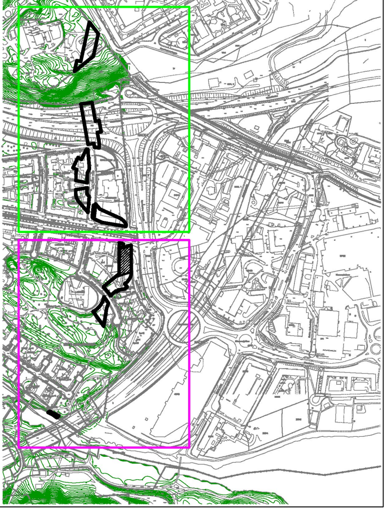
Illustration 1 visar planområdet på baskartan. Del 1 med rosa ram och del 2 med grön ram.