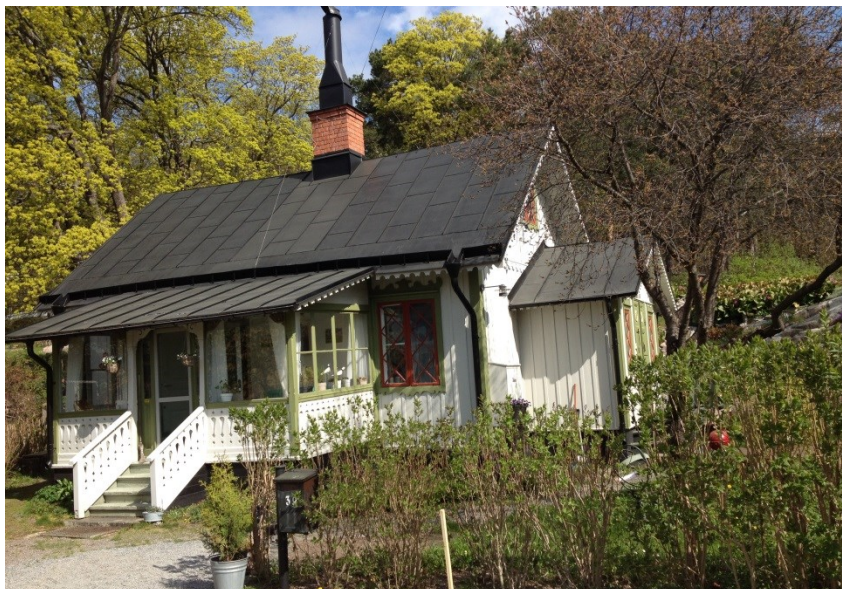
Alphyddan mot Äppelviksvägen (Äppelviksvägen 39)