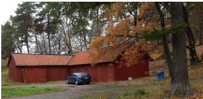
Förrådsbyggnad. Förrådsbyggnaden används idag som förråd av bostadshusen.