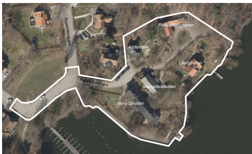
Vit markering visar planområdet.

Planområdet omfattar ca 8000 kvadratmeter. Marken ägs av staden.