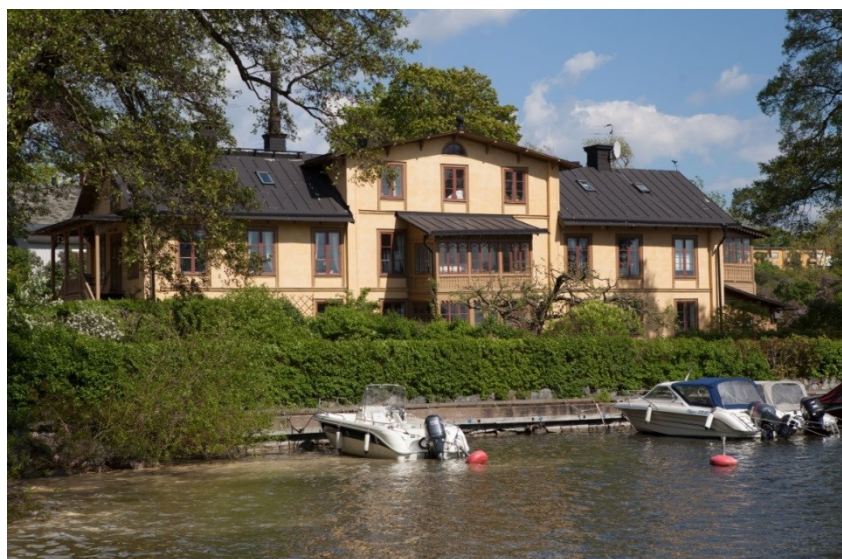
Stora Sjövillan mot Äppelvikshamnen. Foto: Mattias Ek, Stadsmuseet, bildnr. SM_10002259S.

Bryggeriverksamheten lades ner 1864 och Stora Sjövillan byggdes då om till sommarhus för familjen Blackstadius. Under flera år hyrde man ut övervåningen till sommargäster och den södra verandan användes till och med som väntrum för sommargäster som skulle resa med ångbåten från ångbåtskajen intill. Under 1880-talet byggdes huset om till permanentbostad för familjen Blackstadius. Det var då huset fick dagens utformning. Spannmålskvarnen hade från början en s.k. rundgång - en rund lada eller gång för ett dragdjur som gick runt med mekanik som drev kvarnen. Då bränneriverksamheten hade lagts ner byggdes kvarnen först om till drängbostad och då Blackstadius blev permanentboende till mangelbod. Därför kallas det i dag just Mangelbodsvillan. Mangelboden kom så småningom att byggas om till sommarboende för sommargäster. Det hus som idag kallas Lilla Sjövillan uppfördes av familjen Blackstadius för sommargäster under 1800-talets senare del. När Stockholms stad köpte Lilla Sjövillan 1909 lät man uppföra den stora verandan i söder. Även det hus som kallas Alphyddan uppfördes under samma tid för sommargäster.