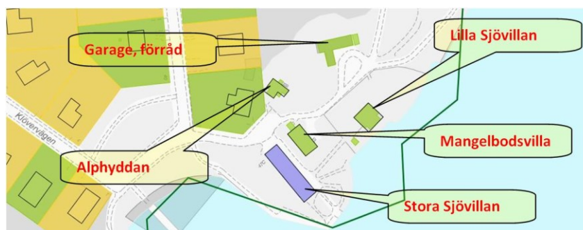
Byggnaderna med kulturhistorisk klassificering