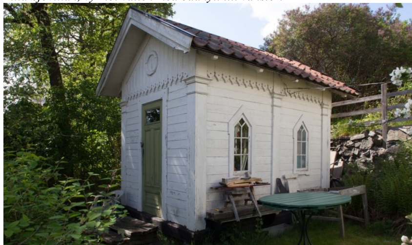
Den välbevarade badhyttan på tomten berättar om badlivets centrala roll på ett sommarnöje.