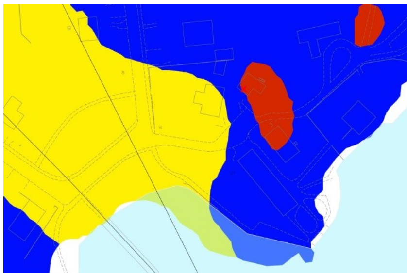
Utdrag ur byggnadsgeologiska kartan över planområdet.