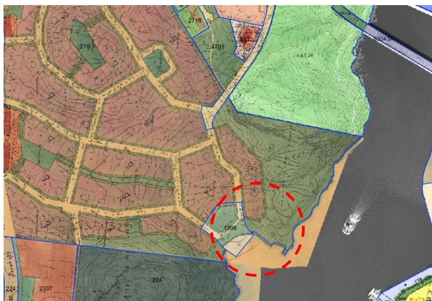
Gällande detaljplaner med ungefärligt planområde markerad i rött.

Planområdet berörs av två gällande detaljplaner, Pl 219 fastställd 1922 och en del av Pl 1398 fastställd 1934. Planer medger allmän platsmark, park inom planområdet.