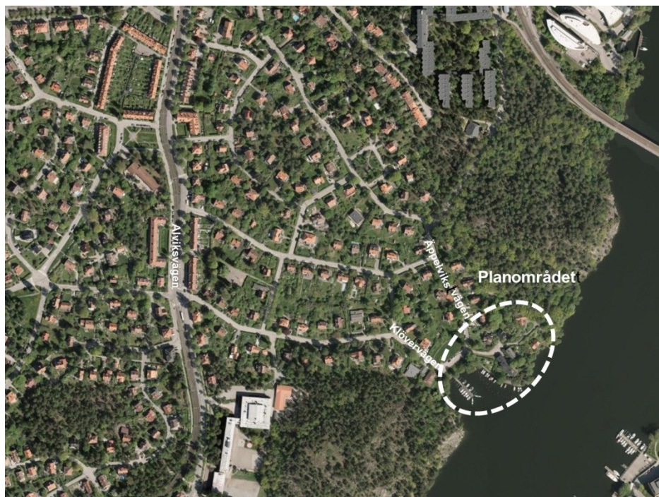
Ortofoto över Äppelviken med planområdet markerad.