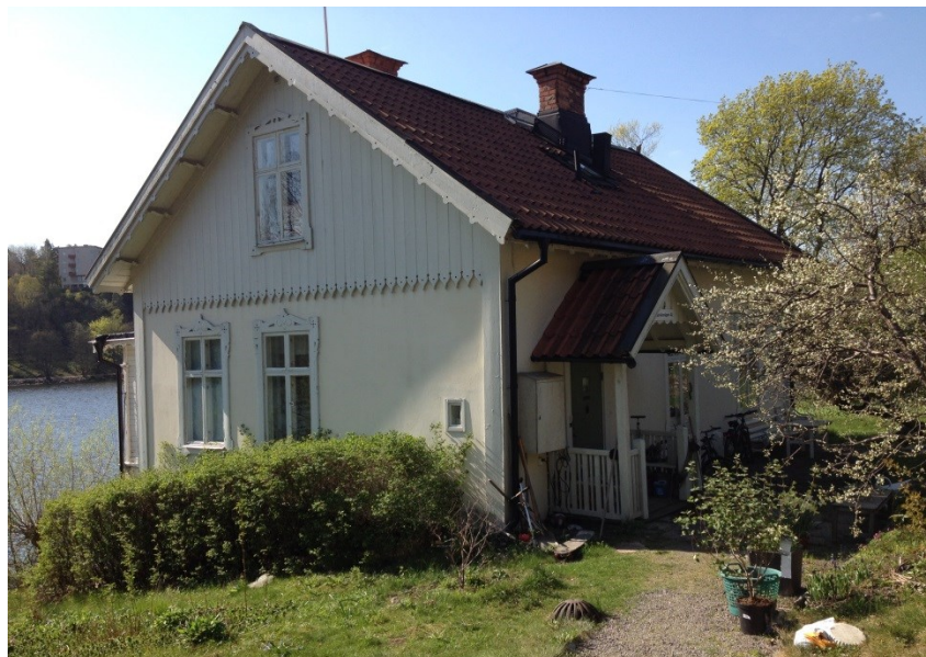
Lilla Sjövillan (Äppelviksvägen 43). En grusad gångväg, delvis belagd med äldre kalkstensplattor, leder fram till entrén.