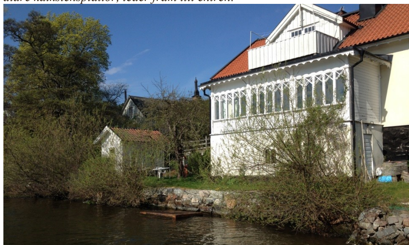
Lilla Sjövillan, vy mot vatten med badhytt till vänster.