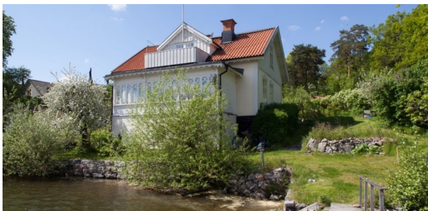
Lilla Sjövillan från vattnet. Den stenskodda kajen, vattenbrynsvegetationen, terrassmurar i trädgården och det äldre äppelträdet till vänster om verandan är exempel på viktiga karaktärsskapande inslag i kulturmiljön. Foto: Mattias Ek, Stadsmuseet, bildnr. SSM_10002220S.