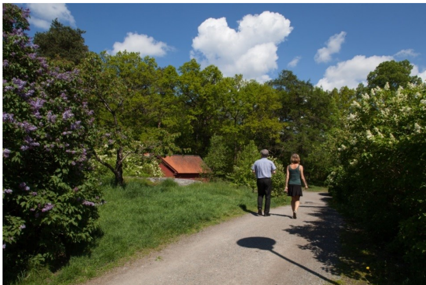
En grusad förlängning av Äppelviksvägen leder besökare och förbipasserande genom området och vidare längs Mälarparken. Vägsträckningen har varit densamma, åtminstone sedan början av 1900-talet.