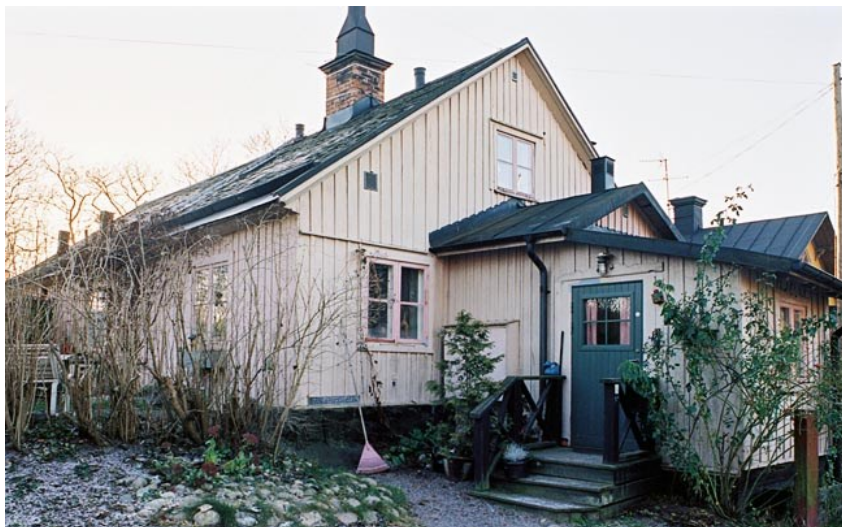
Mangelbodsvillan mot Äppelviksvägen (Äppelviksvägen 45)