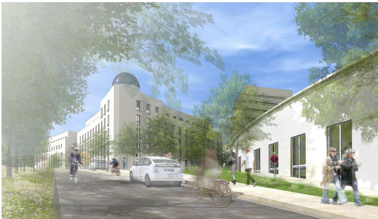
Södra Albano, studenbostäder längs Ruddammsvägen, vy mot söder

En angelägen ekologisk idé i projektet är att skapa en vattenkontakt i östvästlig riktning. I norra Albano anläggs en vattenförbindelse för groddjur, via dagvattenanläggningen och en damm och vidare till Brunnsviken. Dagvattenhanteringen kan fungera som mottagare, fördröjning, reningsfunktion och liknande.