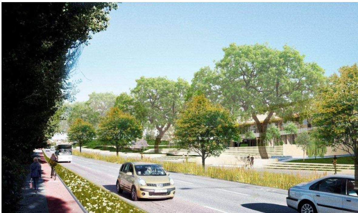
Södra Albano, vy från Roslagsvägen, mot norr

Byggnaderna ska enligt planen uppföras med minst 70 procent så kallade gröna tak, vilket är positivt ur dagvattensynpunkt, liksom den ökade andelen grön mark och föreslagna dammar. Planförslaget bedöms därmed medföra att belastningen på Brunnsviken minskar. Planförslaget medför däremot inte någon rening av väg dagvattnet från Roslagsvägen, vilket innebär att dagvattnet från Roslagsvägen liksom idag kommer att ledas orenat till Brunnsviken. För att underlätta en eventuell framtida rening av dagvattnet från Roslagsvägen föreslås i miljökonsekvensbeskrivningen att dagvattnet från universitets- och bostadsområdena hanteras skiljt från Roslagsvägens väg dagvatten.