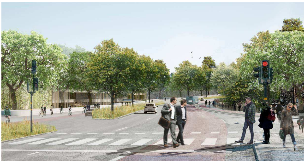
Norra Albano, mot Roslagsvägen, vy mot söder

Gestaltningssprogrammet innehåller också förslag till damm och grodtunnel, som kan stärka områdets kvaliteter för groddjur och andra vattenlevande organismer, vilket medför positiva konsekvenser om det genomförs.