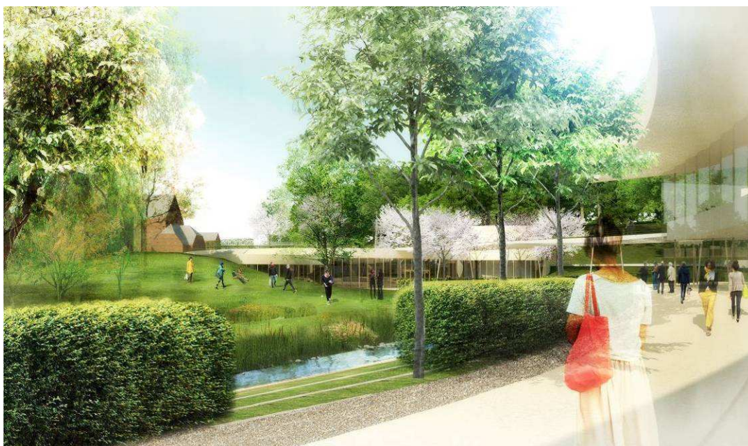
Södra Albano, i ravinen, mot entrébyggnaden

Större delen av dagvattnet från planområdet mynnar idag i Brunnsviken som, enligt EU:s ramdirektiv för vatten, har en ”otillfredsställande ekologisk status”. Vattenmyndigheten har fastställt att Brunnsviken ska kunna uppnå miljö kvalitetsnormen god ekologisk status till år 2021.