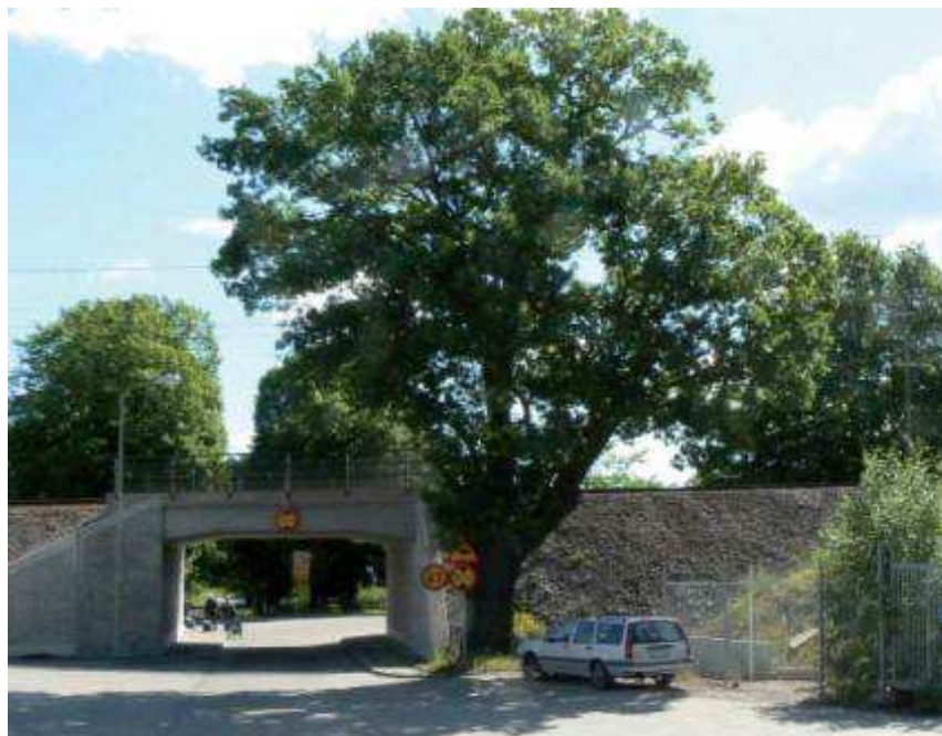
Den stora eken vid porten till Nationalstadsparken, vy mot öster

Planförslaget innebär att området får en ökad tillgänglighet och utgör en entré, varifrån man tar sig ut i rekreationsområdena på Norra Djurgården.