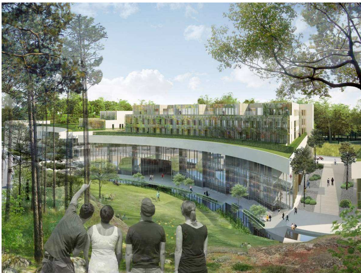
Bebyggelsen i Norra Albano mot ravinen med öppen dagvattenkanal, vy från Albanoskogen mot öster

För samtliga byggnader gäller de krav på utformning och föreskrifter som anges i gestaltungsprogrammet, som upprättas parallellt med planförslaget. Hänvisning till gestaltungsprogrammet finns på plankartan. Fasader i ljus puts ska vara karaktärsdanande för området.