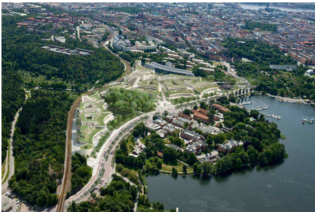
Fotomontage, vy mot söder

Söderbrunns koloniområde vid Björnnäsvägen, strax öster om Albanoområdet, är Stockholms äldsta koloniområde som fortfarande är i bruk och därmed en betydelsefull del av odlingslandskapet inom Nationalstadsparken.