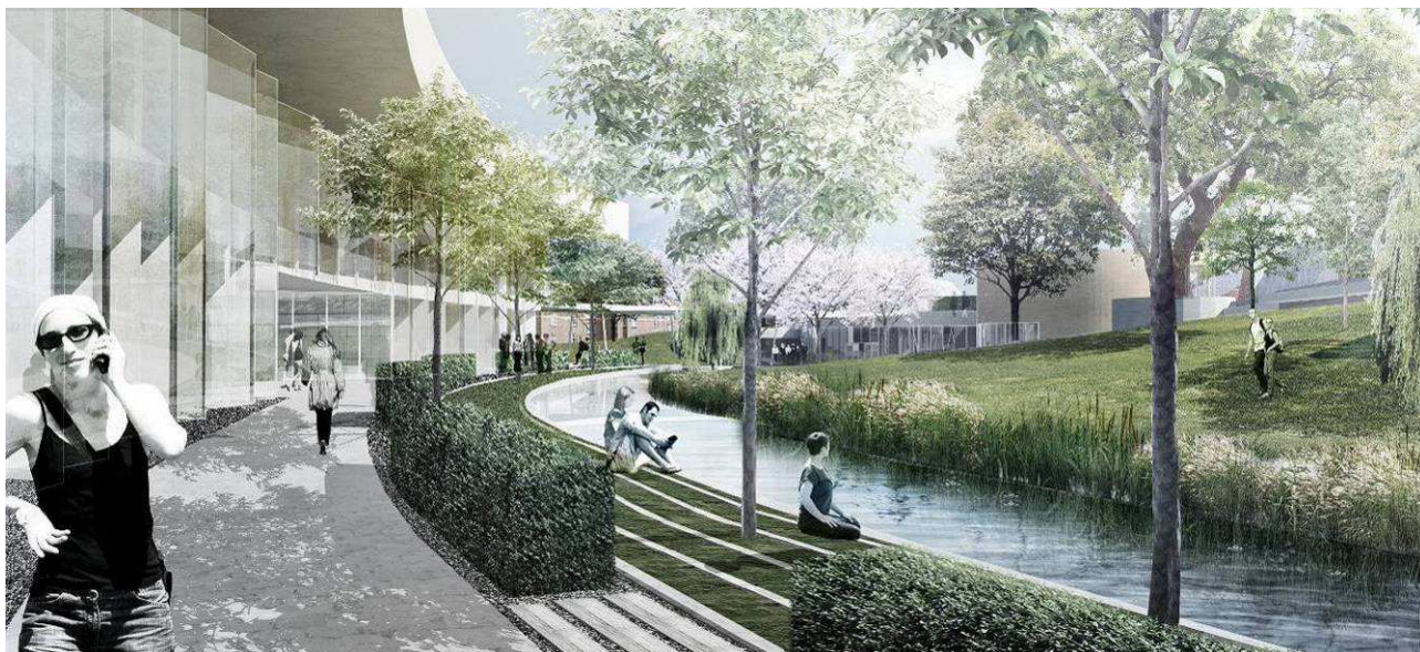
Södra Albano, i ravinen, vy mot väster

Albanoområdets sammanhängande motiv är den anlagda ravinen som löper längs bebyggelsens fronter. Den ligger i ett försänkt läge och dramatiserar landskapet kring Albanoskogen. Här skapas en parkmiljö av hög kvalitet, skyddad från Roslagsvägens trafikbuller. På ravinens nivå möter universitetet naturen dels inomhus med gröna slänter som motiv för de uppglasade fasaderna, dels utomhus där byggnadernas terrasser möter ett kontinuerligt vattenstråk. Den skyddade parkmiljön är sammanhängande i norra respektive södra Albano.