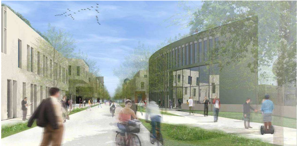
Södra Albano, Bellevuestråket, vy mot öster

Albanoteatern är en av campusområdets viktigaste samlingsplatser. Platsen med gröna södervända gradänger omsluts av en sammanhängande fasad, med portiker, som förstärker parkrummet genom sin halvcirkulära form.