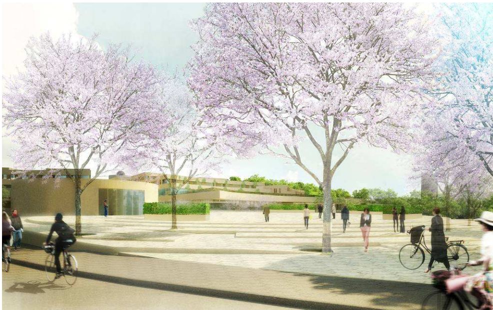
Södra Albano, entrén mot Roslagsvägen, vy mot söder

Bebyggelsen inom planområdet är omfattande och för att behärska tätheten har campusområdet getts en solfjädersform. På detta sätt kan upplevelsen av bebyggelsemassan dämpas och områdets landskapsmässiga potential komma till sin rätt, formen möjliggör utblickar från såväl gränderna mellan husen som från byggnaderna.