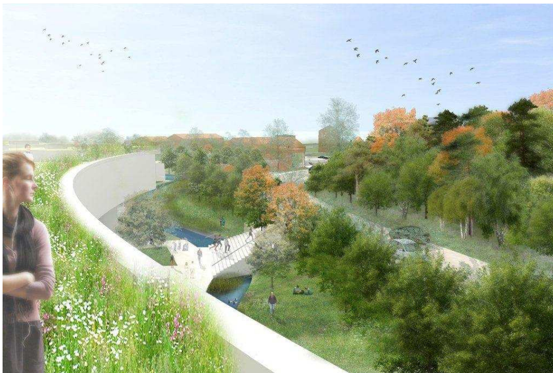
Södra Albano, vy från bostadshusets terrass, mot väster

Gestaltningssprogrammet innehåller också förslag till damm och grodtunnel, som kan stärka områdets kvaliteter för groddjur och andra vattenlevande organismer, vilket medför positiva konsekvenser om det genomförs.