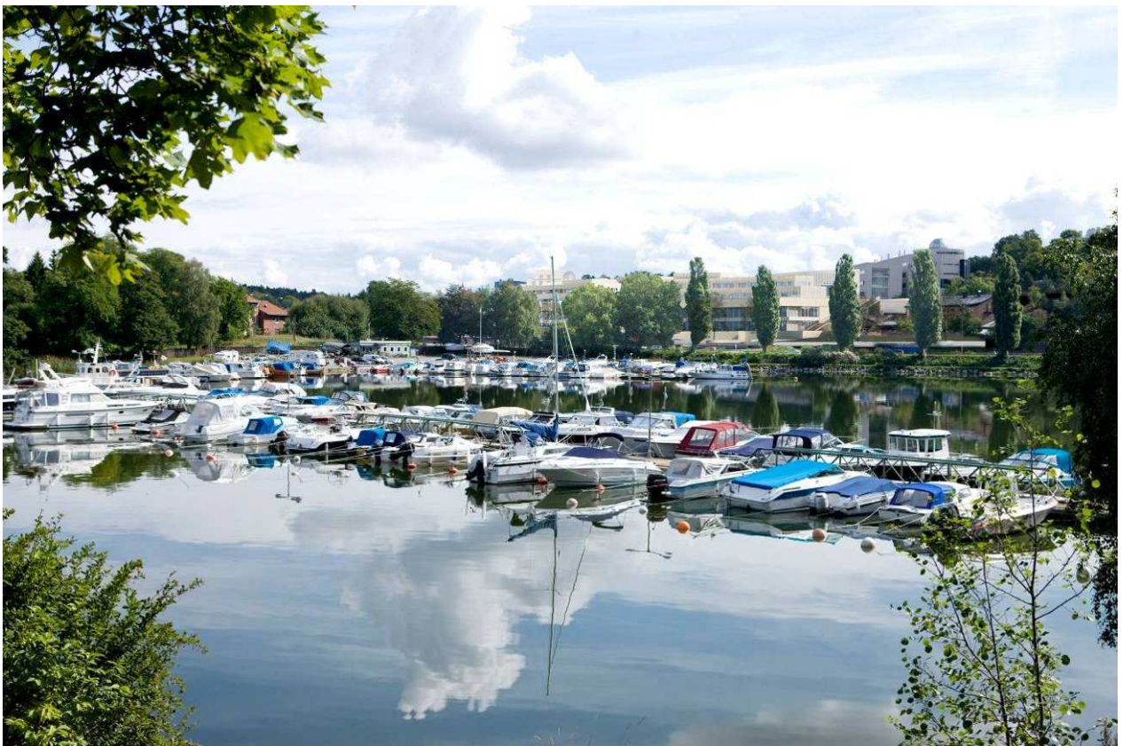
Vy från Bellevue mot Albano, mot öster

Albano är relativt avskärmat från övriga delar av Nationalstadsparken, till följd av de kraftiga barriärer i form av Roslagsvägen och Roslagsbanan som kringgärdar området. Södra Albano utgörs till största delen av före detta industri- mark, där nästan all bebyggelse är riven. Området genomkorsas av industrispåret Värtabanen och används idag endast i begränsad omfattning, bland annat för etableringar för bygget av Norra länken.