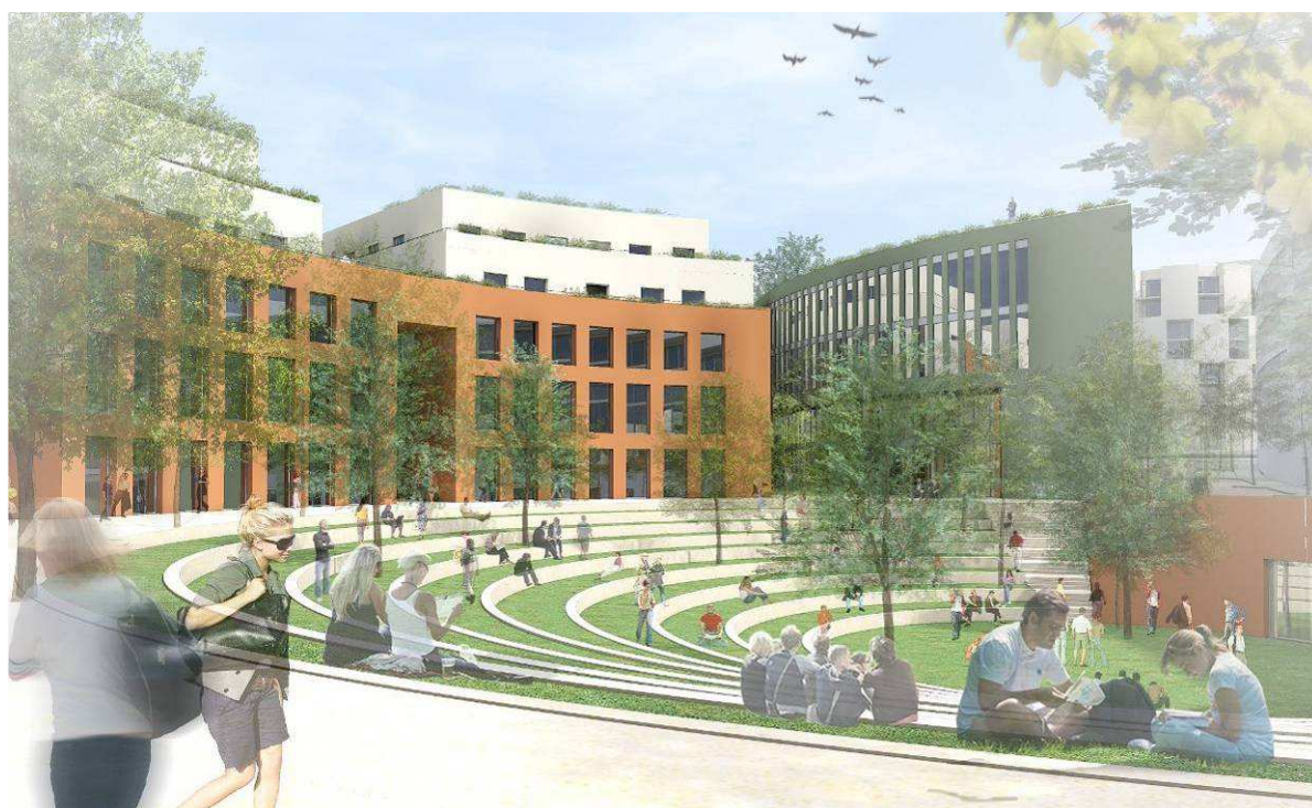
Södra Albano, Albanoteatern, vy mot öster

Albanoteatern med halvcirkelformade gradänger som trappas mot söder blir en central träffpunkt och vistelseyta för hela det södra campusområdet. På motsvarande sätt kan gårdarna som vänder sig mot Albanoskogen i det norra delområdet få en funktion som gemensam utemiljö för bostäder och institutioner.