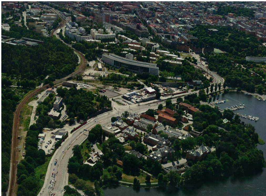
Flygbild över Albano, mot söder