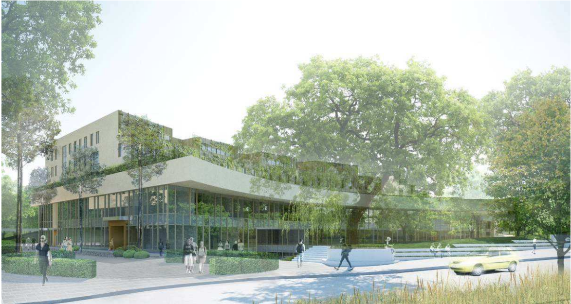
Norra Albano, entrén mot Roslagsvägen, vy mot öster

Planens utformning syftar till att tillgodose Nationalstadsparkens kultur- och naturvärden, silhuett och siktlinjer samt bebyggelsens samspel med landskapet och naturen. Utöver att klara landskapssilhuetten och naturmiljöerna, handlar projektet också om att skapa en helhet – ett universitetsområde med en offentlig karaktär och med ett uttryck som markerar en viktig institution i samhället.