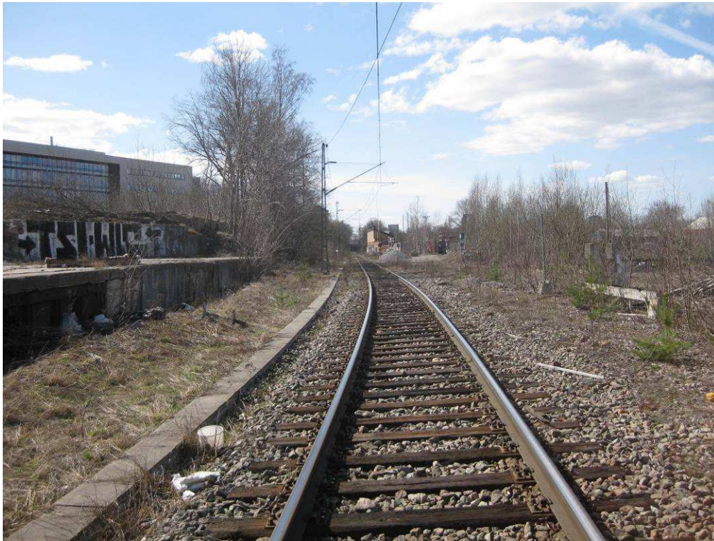
Värtabanen, vy mot väster

Under planområdet passerar tunnelbanans röda linje mot Mörby centrum. En ny tunnelbanestation i Albano, mellan stationerna Tekniska Högskolan och Universitetet, har tidigare studerats. Studien visar att det är tekniskt möjligt att anlägga en station inom området, det är dock ännu inte aktuellt. Ett nytt system med spårtaxi kan vara en möjlighet som bör studeras som ett alternativ i framtiden.