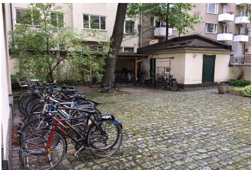
Södra delen av innergården har bland annat plats för cykelparkering och rymmer en mindre gårdsbyggnad för avfallskärl.

Bilparkering sker på gatan. Ett allmänt parkeringsgarage finns inom kvarteret Ynglingen, på motsatt sida av Sibyllegatan.