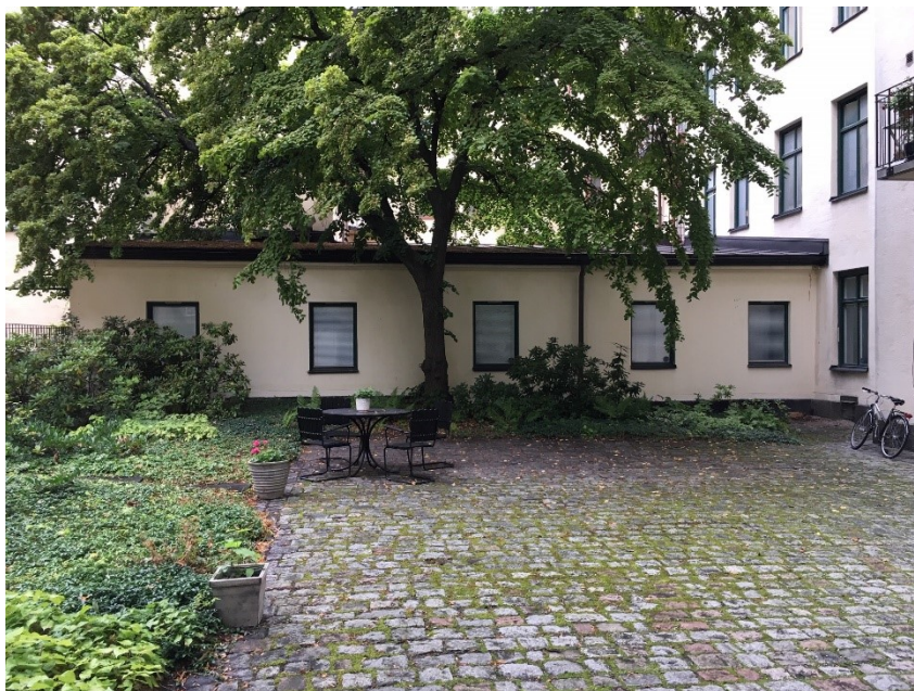
Gårdsbyggnaden som i planförslaget görs planenlig och kan byggas om till en lägenhet.