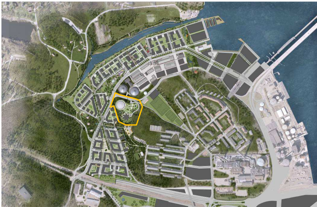
Illustrationsplan med planområdet markerat

Stockholms stad är lagfaren ägare av all mark inom det avgränsade detaljplaneområdet.