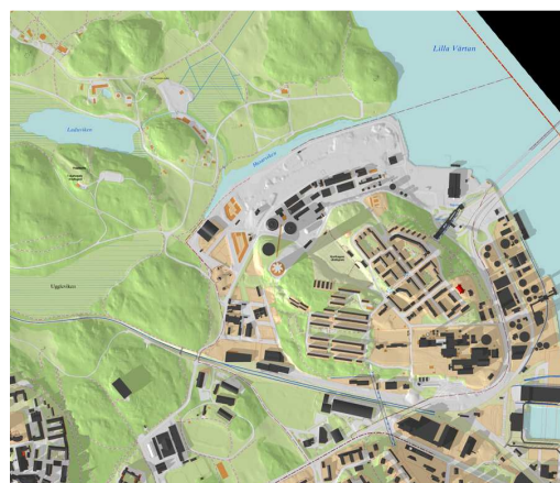
Planförslagets byggnad, 21/3 kl 15.00

För lokalklimatet har vindstudier genomförts för gårdsmiljön. Den v-formade planlösningen fångar upp och dämpar vinden lokalt, även om en högre