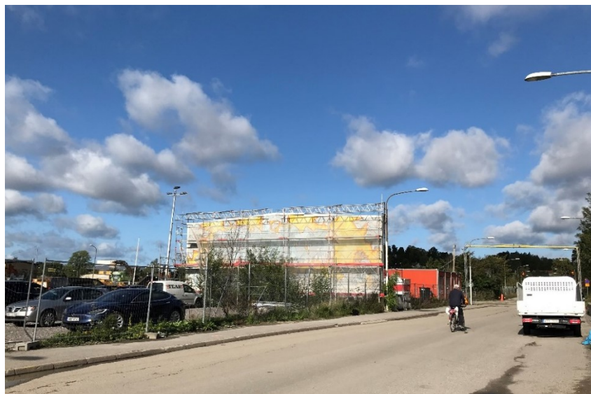
Bilder tagna 2019. Enbart väggen med målningen står kvar. Väggen stöttas upp av en provisorisk stålkonstruktion.