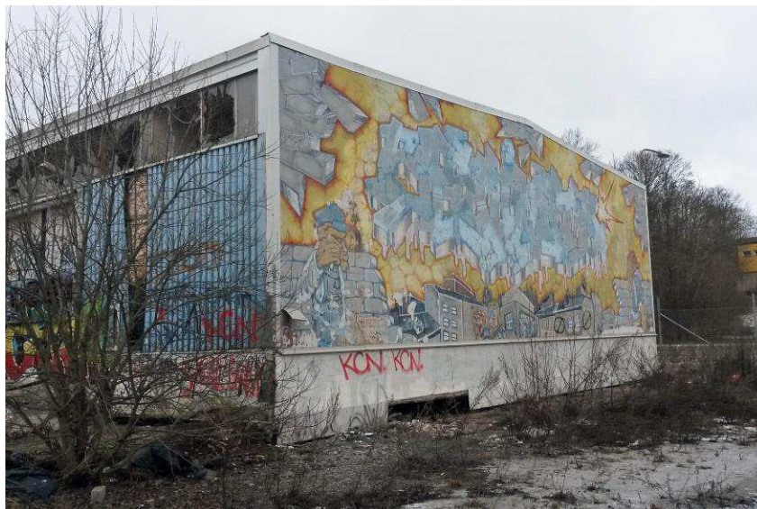
Bild från åtgärdsprogrammet för målningen (2015). Bild tagen 2015.