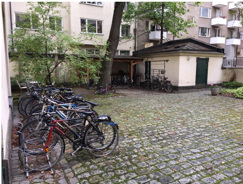
Södra delen av innergården har bland annat plats för cykelparkering och rymmer en mindre gårdsbyggnad för avfallsskär.