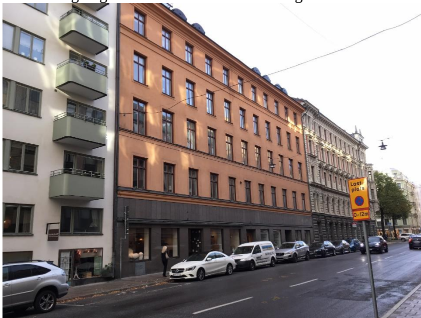
Fasad mot Sibyllegatan.

Bebyggelsen inom fastigheten uppfördes ursprungligen 1881 och är den äldsta byggnaden inom kvarteret Forellen. Byggnaden har genomgått en del ändringar sedan den uppfördes, både vad gäller fasadutformning, inredning av vind till bostäder och förändringar av entrévåning. Entrévåningen utgörs av lokaler för läkarmottagning samt en möbel- och inredningsbutik.