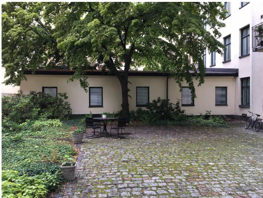
Gårdsbyggnaden som i planförslaget görs planenlig och kan byggas om till en lägenhet.