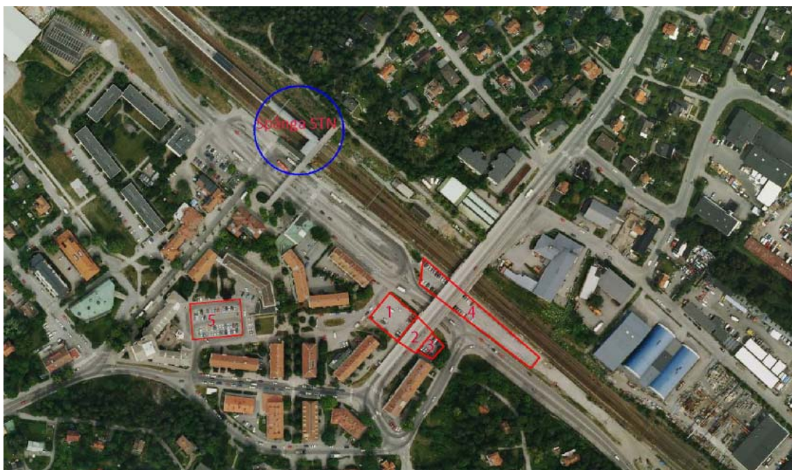
Bild 1. Områdesbild med studerade parkeringar.