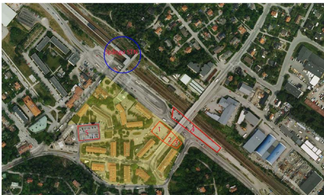
Bild 3. Områdesindelning för bilarnas härkomst.

Vid två tillfällen undersöktes bilarnas härkomst. Genom att söka efter registreringsnummer kunde postnummer för ägaren av bilen tas fram och kategoriseras. I undersökningen har bilarna sorterats in under tre kategorier, Inom området (se gulmarkerat område), Spånga och utom Spånga.