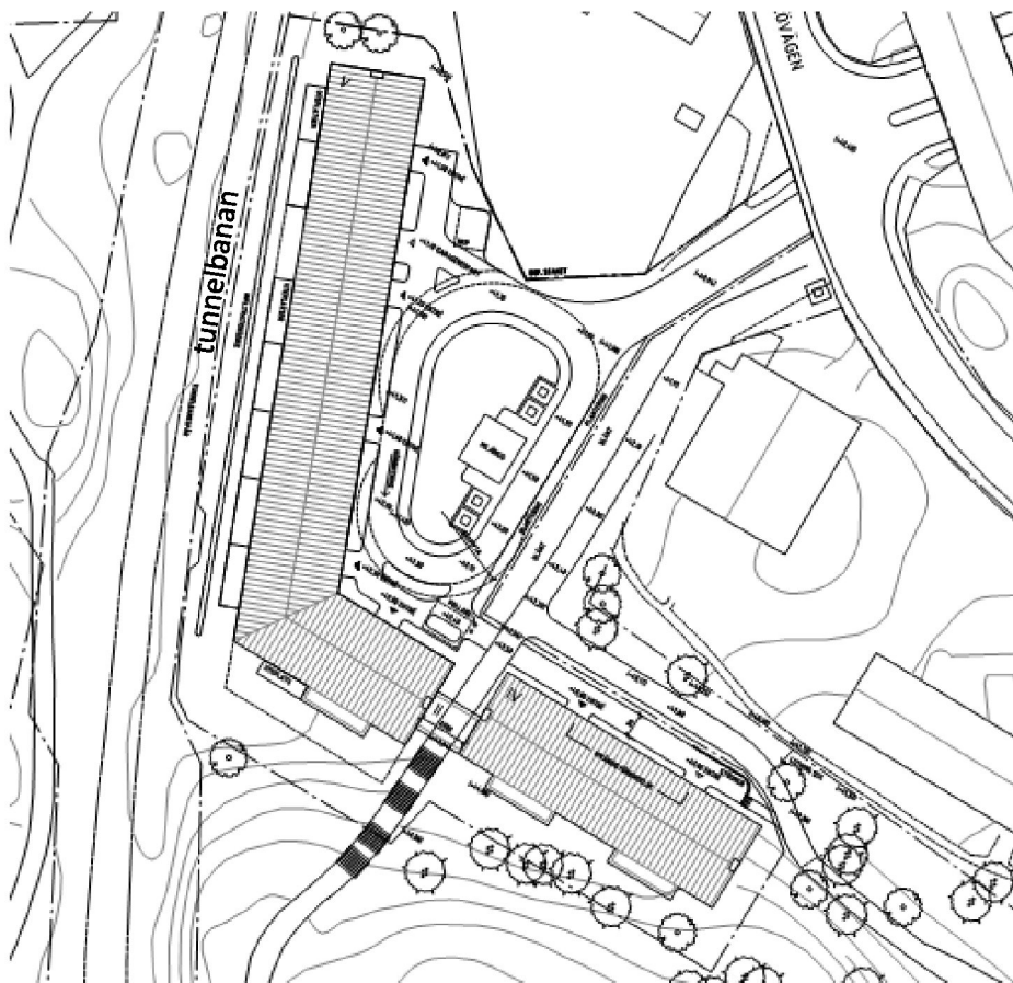
Figur 2. Planerad bebyggelse.

Detaljplanen syftar till att möjliggöra byggnation av ca 75-100 bostäder. Bebyggelsen planeras huvudsakligen med 4-5 våningar (se figur 2).