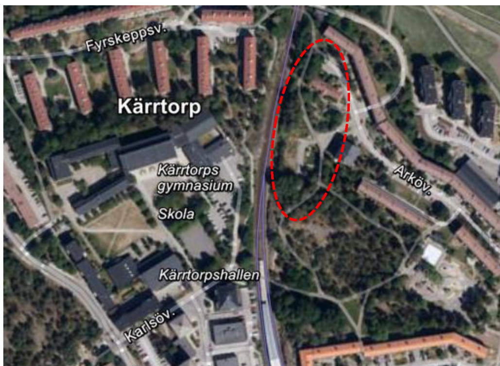
Figur 1. Lokalisering av aktuellt planområde (inringat) inklusive den närmaste omgivningen.

Vid Arkövägen i stadsdelen Kärrtorp i Stockholms stad har ett planarbete påbörjats som syftar till att möjliggöra uppförande av ny bostadsbebyggelse i närheten av Kärrtorps centrum. Det aktuella området ligger i anslutning till tunnelbanans gröna linje (se figur 1).