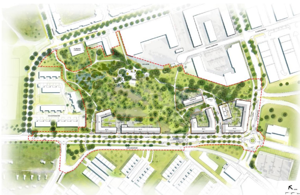
Figur 2.1. Illustrationsplan på planerad kvartersstruktur, daterad 2020-06-11.

Inom området planeras nya kvarter med tillhörande infrastruktur enligt nedanstående Illustrationsplan.