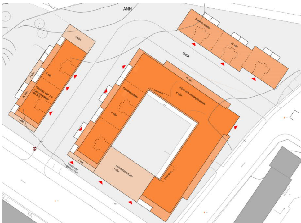
Figur 1. Situationplan planerade byggnader, MAF Arkitektkontor AB, 2018-05-04.

Den planerade byggnationen utgörs av vård- och omsorgsboende, seniorbostäder samt förskola i 4 – 5 våningar med lågdelar i 1-2 våningar (figur 1). Befintligt vård- och omsorgsboende planeras att rivas för att möjliggöra nybyggnaden. Detaljer såsom nivå på färdigt golv samt laster finns ej i nuläget.