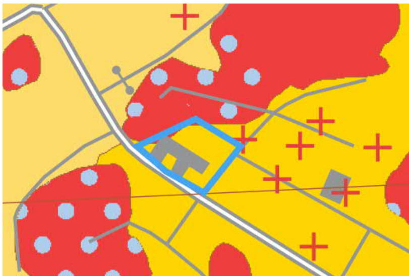
Figur 3, SGU's jordkarta med ungefärlig placering av undersökningsområdet markerat med blå polygon.