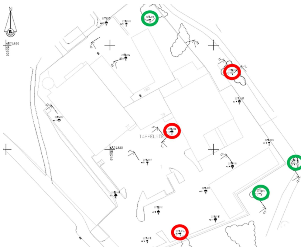
Figur 8.1 Provpunkter och resultat för sulfidhaltigt berg.

För de 3 punkter som har högre resultat än gränsvärdet har kompletterande labbanalyser utförts, dels ABA-tester och dels NAG pH-tester, och resultaten visar för samtliga prover att de är syraproducerande eller potentiellt syraproducerande.