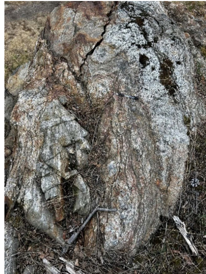
Figur 11.2-11-3 Befintlig bergslänt söder om fastigheten

Bergarterna består i hela området av en gnejs vilken uppvisar en ådrighet. Kornstorleken är varierande från mycket finkornig i de mörka banden till medelkornig i de ljusare kvarts- och fältspatförande banden. Granater förekommer frekvent i bergarten. Gnejsigheten är något vindlande och uppvisar på flertal ställen veckstrukturer orsakad av plastiska deformationer. Pegmatiter förekommer ställvis upp till 20 cm breda.