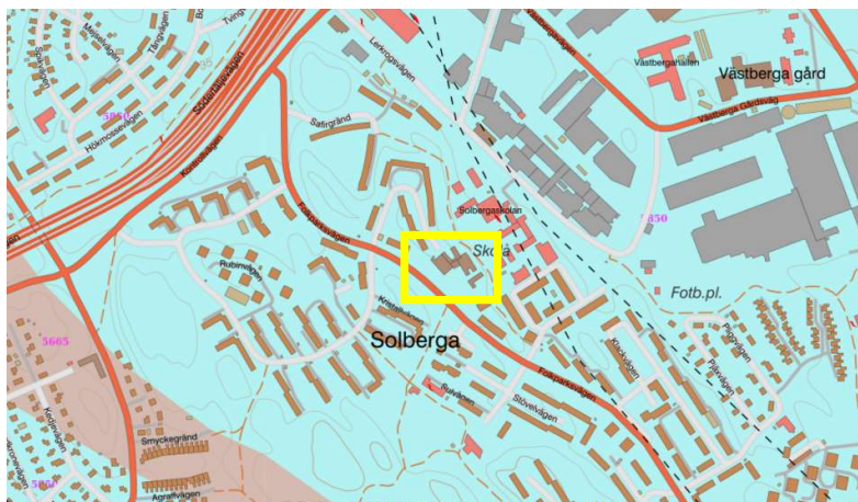
Figur 7.1 Utdrag ur SGU Kartvisaren "Berggrund 1:50 000 - 1:250 000"

Ljusblå färg i figuren nedan är beskrivet som: 5850; Vacka; Svekokarelska orogenen, metamorf intrusiv- och ytbergart 1,87–1,92 miljarder år. Streckade linjer markerar tektonisk foliation. Gul rektangel visar ungefärligt undersökt område.