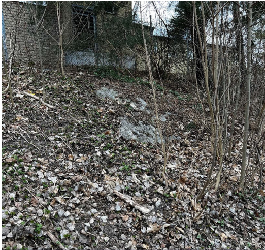
Figur 11.1 Befintlig håll i norra delen av fastigheten

Befintliga hållar i området har studerats och hållområdena är till stora delar mossbevuxna och begränsade i storlek, se figur nedan, så därför har sprickkartering inte kunnat utföras.