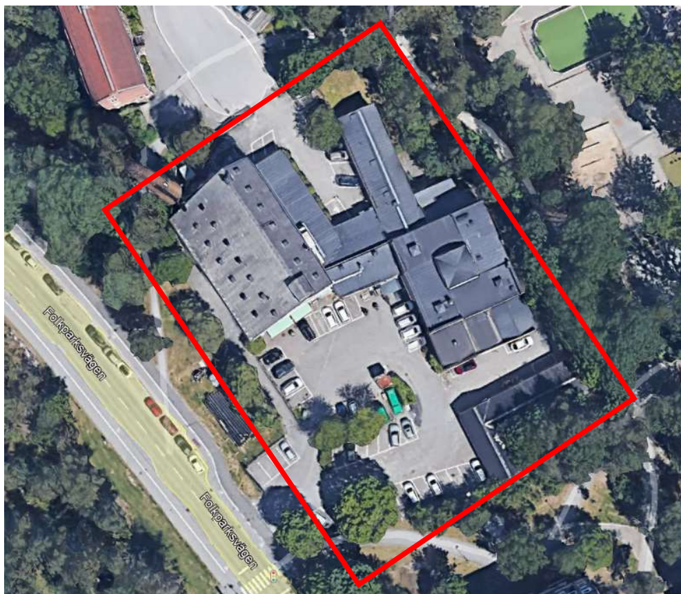
Figur 1.1 – Aktuell fastighet

Den aktuella fastigheten är belägen öster om Folkparksvägen i Hägersten, se figur 2.1 nedan.