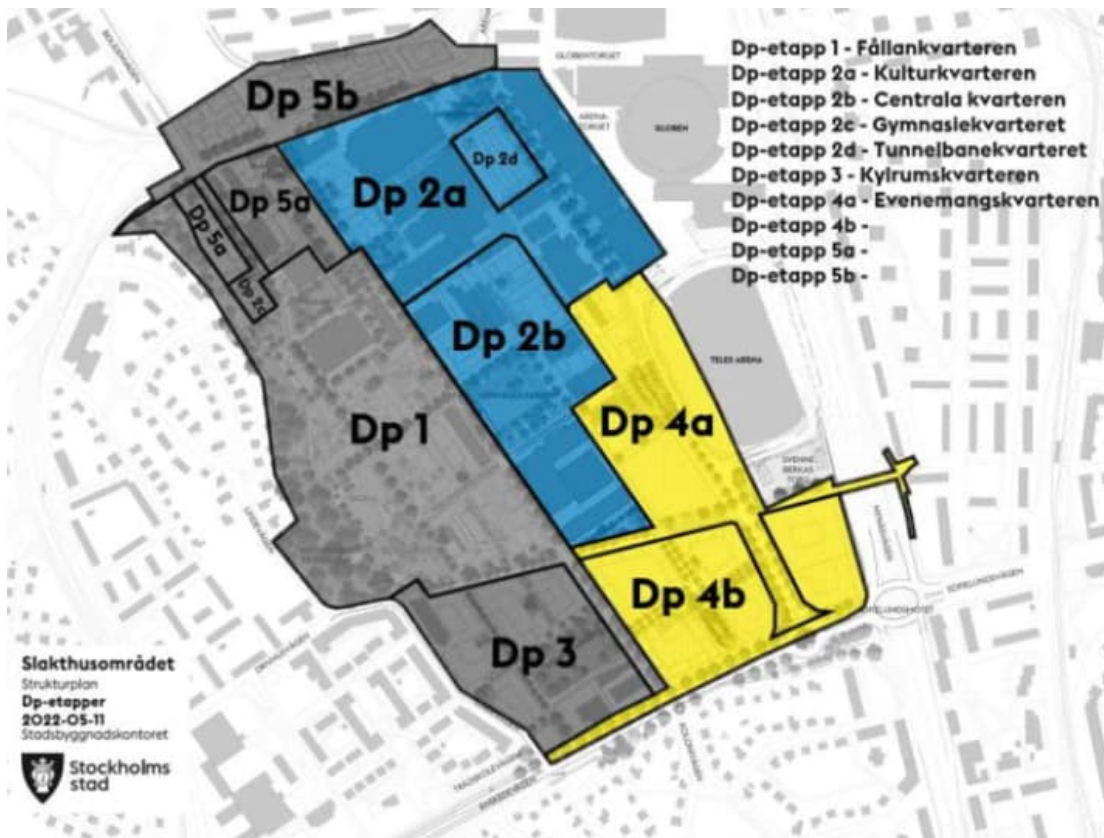
Figur 1. Översikt med de olika detaljplaneområdena inom Slakthusområdet, där nu aktuella områden (Dp2a, Dp2b, Dp2d, Dp4a, Dp4b) ligger inom östra delen av området.

Denna systemhandling avser detaljplaneområdena Dp2a, Dp2b, Dp2d, Dp4a och Dp4b, inom östra delen av Slakthusområdet, se figur 1.