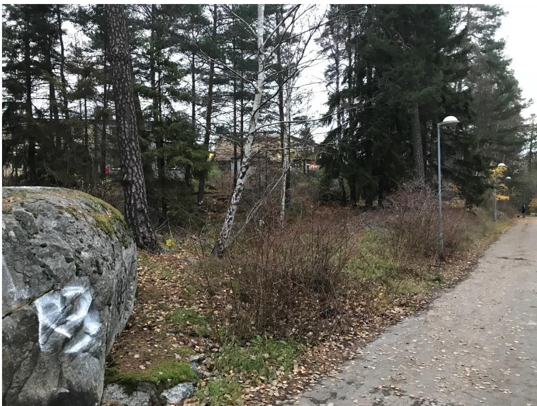
Figur 2: Foto som visar gc-vägen väster om Björnmossevägen. Foto taget mot norr.

Detaljplaneområdet avgränsas i norr av detaljplaneområdet för "Detaljplan – Björnmossevägen Mellersta, Kälvesta, Stockholms Kommun" med uppdragsnummer 18 13 76, i öster av gc-väg och ett mindre skogsparti, i väster av gc-väg samt en slänt upp till befintligt bostadsområde och i söder av Björnbodaskolan och fortsättningen av Björnmossevägen.