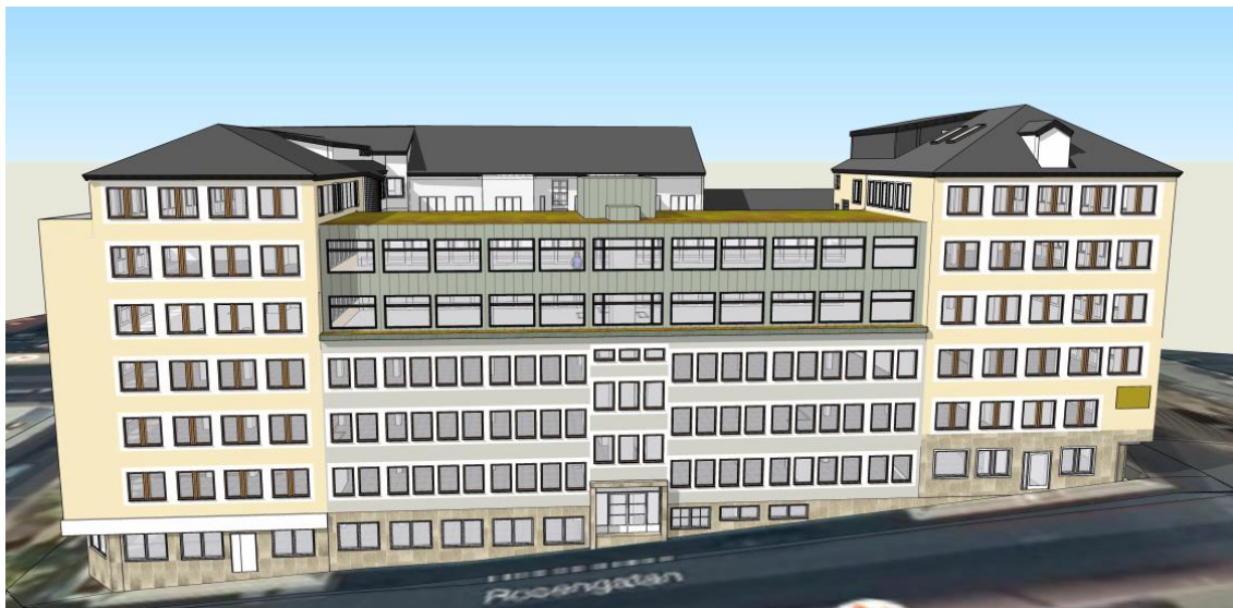
Figur 2. Figuren visar den planerade utformningen av påbyggnaden. Urklipp från illustration av utformning vy alt. 4 från Thule Fastighetsutveckling AB.