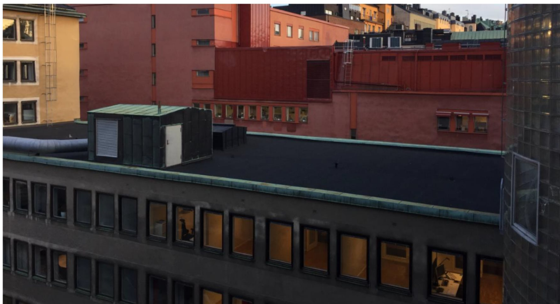
Figur 1. Nuläge: Tak med kopparkrön och kopparklätt fläktrum.