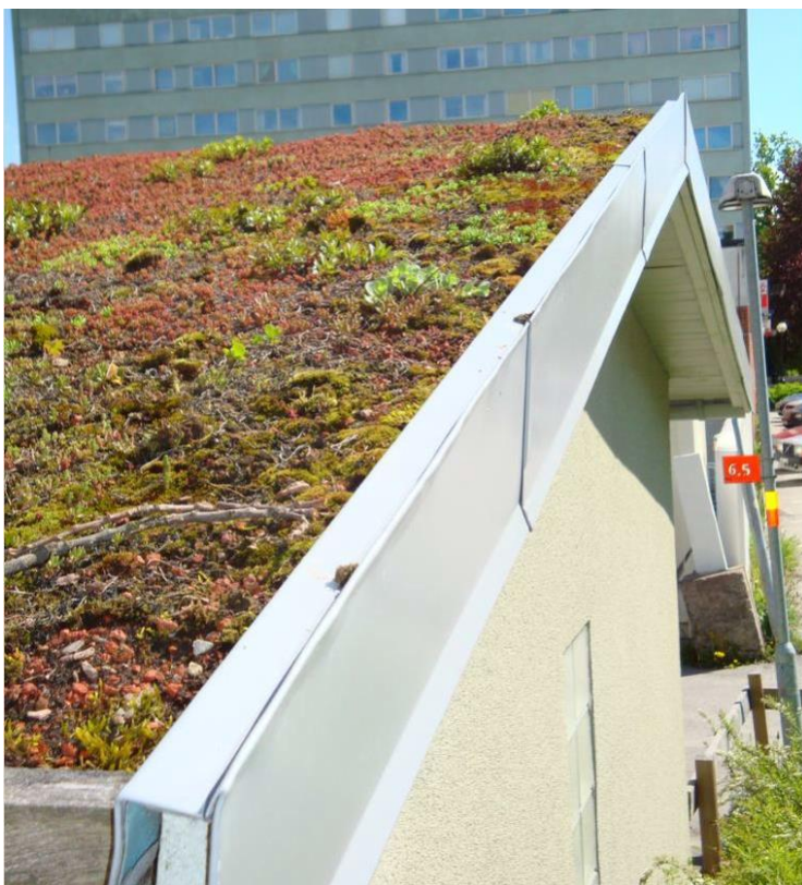
Figur 3. Exempel på extensivt grönt tak.

Alla gröna tak kan behöva lagning av kala fläckar, där skott kan tas från tätvuxna delar. Detta ska göras i maj-september. Krattning rekommenderas och takbrunnar och hängrännor ska hållas fria från skräp. I Figur 3 visas ett exempel på hur ett extensivt grönt tak kan se ut. Gröna tak som dagvattenanläggning fyller för det mesta funktion av fördröjningsanläggning för att minska avrinning från takytor.