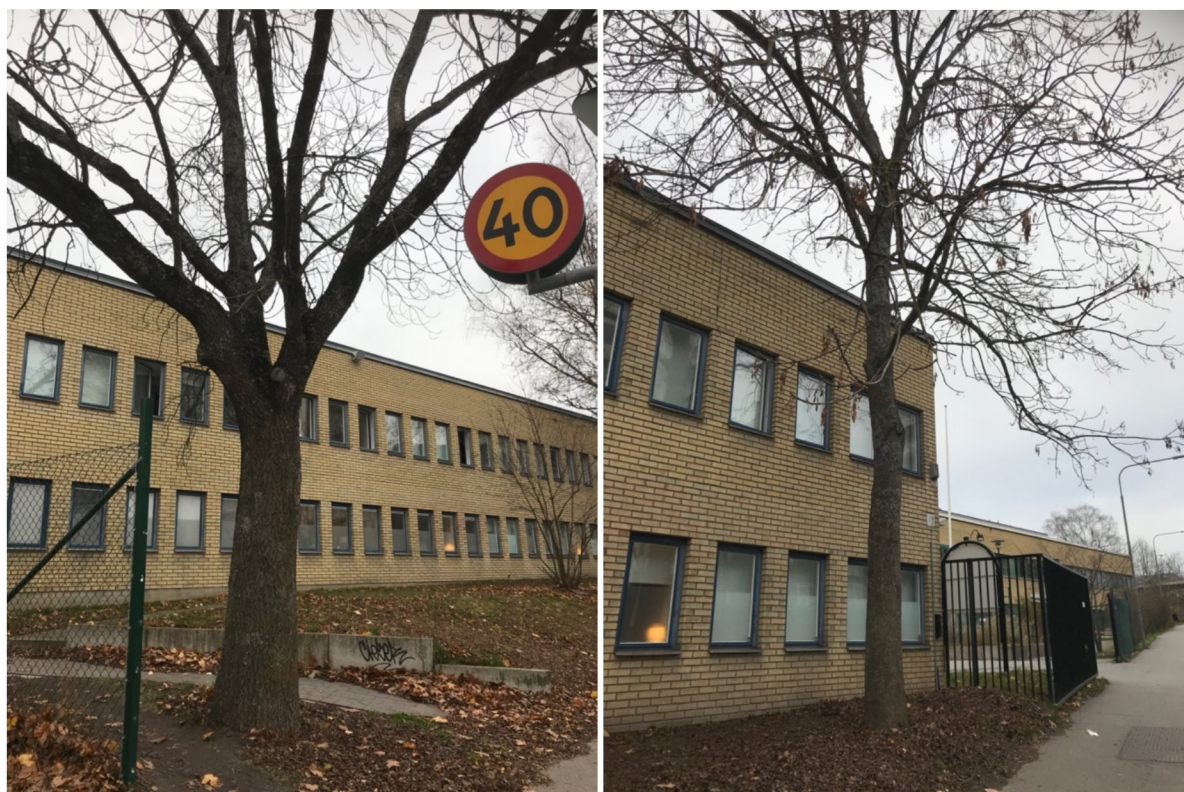
Figur 2. Ask 3 (t.v.) som är naturvärdesträd och ask 1 (t.h.).