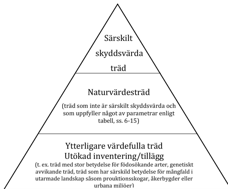
Figur 1. Schemat visar prioriteringsordning för inventering av naturvärdesträd.

Länsstyrelsens bedömning är att åtgärder som berör särskilt skyddsvärda träd ska anmälas för samråd enligt 12 kap 6 § miljöbalken.