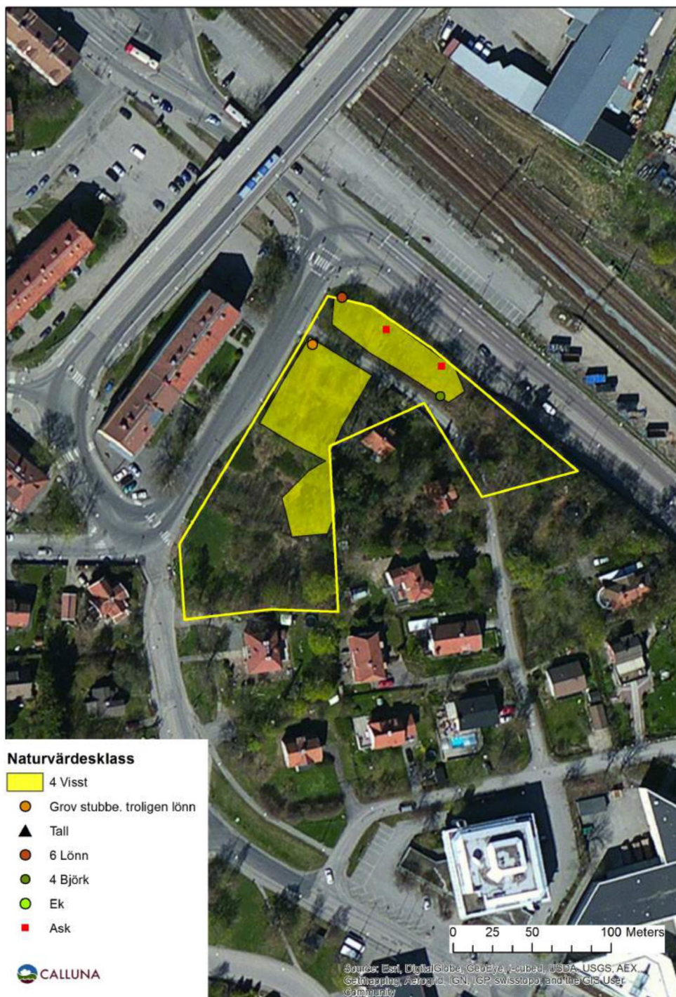
Figur 1 där Inventeringsområdet är avgränsad med gul linje.

Området som inventerades är 0,7 hektar stort. Totalt avgränsades ett naturvärdesobjekt på 0,2, lövskog med visst naturvärde. Naturvärdesobjektet ligger på båda sidor om Stinsbacken, se figur 1.