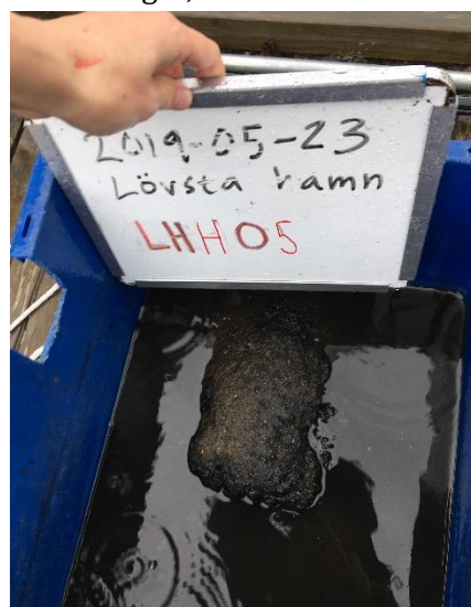
Figur 1. Svart sediment med organiskt material i hugg LHH05.

Levande fauna detekterades i två av de fem bottenhugg som utfördes (Tabell 2). I det ena hittas två fjädermygglarver (Chironomidae) och i det andra hittades en allmän klotmussla ( Sphaerium corneum ). I resterande hugg hittades ingen levande fauna men skal av vandrarmussla ( Dreissena polymorpha ) hittades i flera hugg. I hugg LHH05 längst in i hamnen