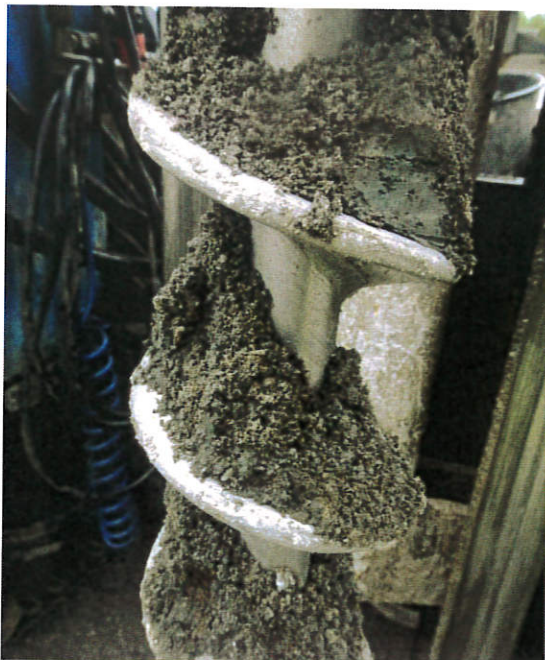
Figur 13: 16S007, 1,0-2,0 m