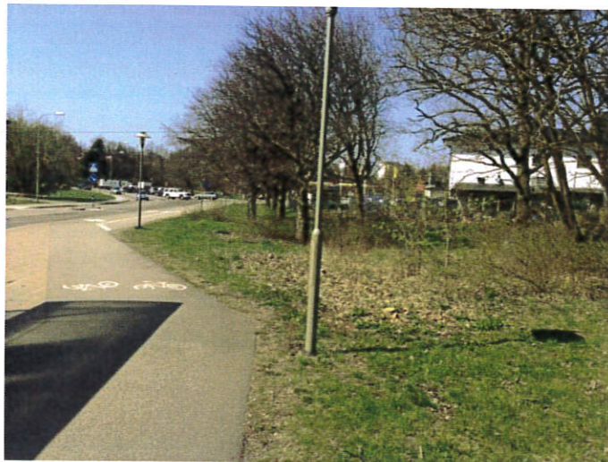
Foto 1. Undersökningsområdet norr om Rågsvedsvägen. Vy mot nordväst.

Två företag är registrerade på plats, enligt eniro.se 1 ; MECA Sweden AB, samt Lundblad Motor & Service AB. Inne på fastigheten Tanklocket 1 och väster om byggnaden (Lundblad Motor och Service AB) bedriver ST1 drivmedelshantering i form av en automatstation.