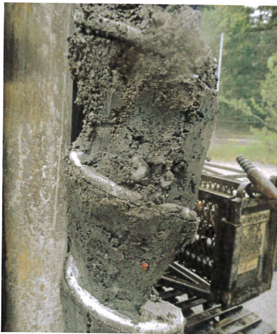
Figur 15: 16S008, 1,0-1,2 m