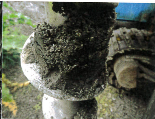
Figur 8: 16S005, 0,7-1,0 m