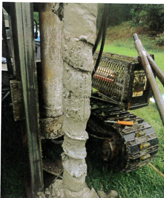
Figur 5: 16S003, 3,0-4,0