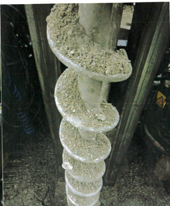
Figur 10: 16S006, 0-1,0 m