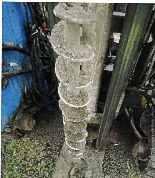
Figur 7: 16S005, 0-1,0 m