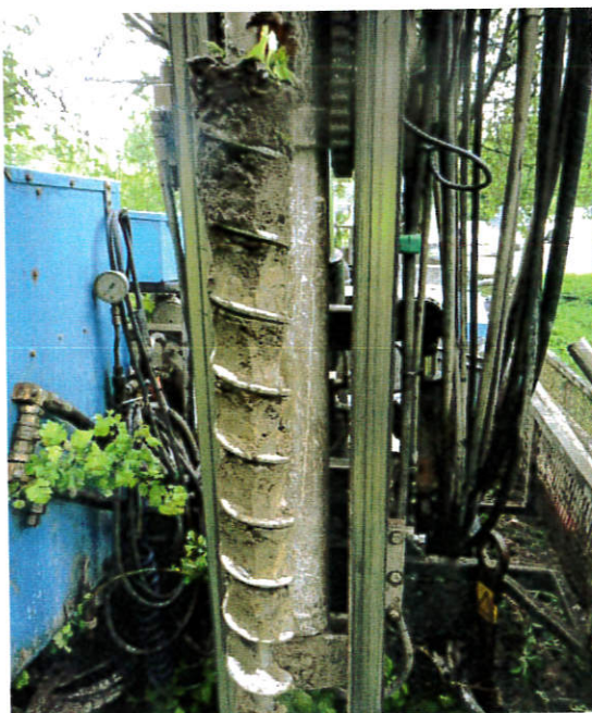
Figur 1: 16S001, 0-1,0 m