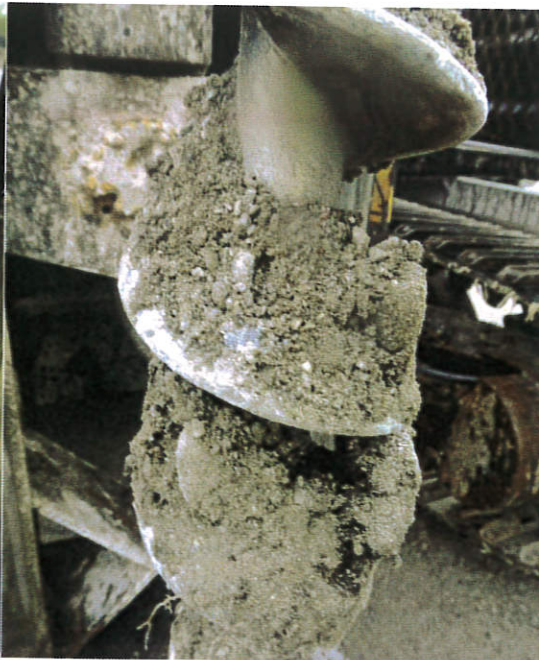
Figur 14: 16S008, 0-1,0 m