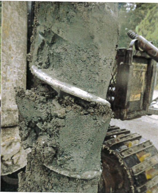
Figur 16: 16S008, 1,2-1,4 m