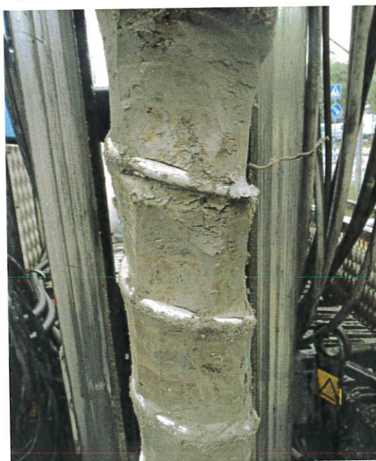
Figur 11: 16S006, 1,4-1,6 m