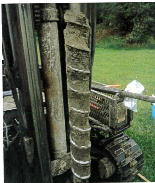
Figur 3: 16S003, 0,2-1,0 m