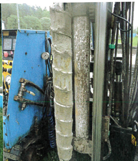
Figur 4: 16S003, 1,0-2,0 m