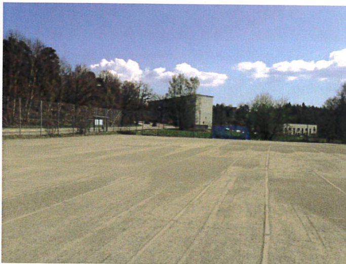
Foto 2. Undersökningsområdet söder om Rågsvedsvägen. Vy mot sydväst.

Söder om Rågsvedsvägen består en stor del av sydöstra delen av undersökningsområdet av en flack grusad yta (inhägnad fotbollsplan) (Foto 2). I detta område placerades sex borrhölar (16S003 – 16S008). I rör 16S003 installerades ett grundvattenrör.