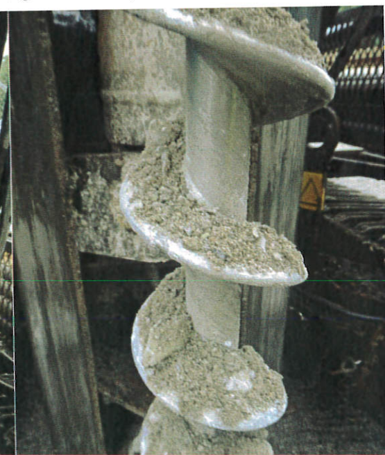
Figur 12: 16S007, 0-1,0 m