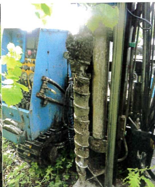
Figur 2: 16S002, 0-1,0 m