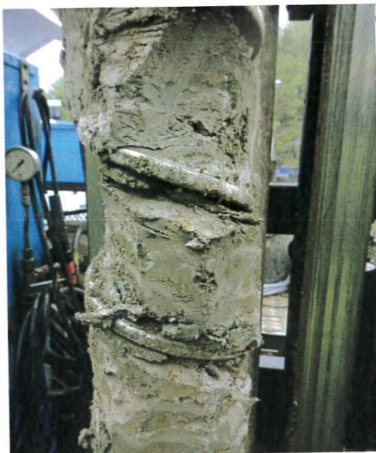
Figur 9: 16S005, 1,3-1,5 m