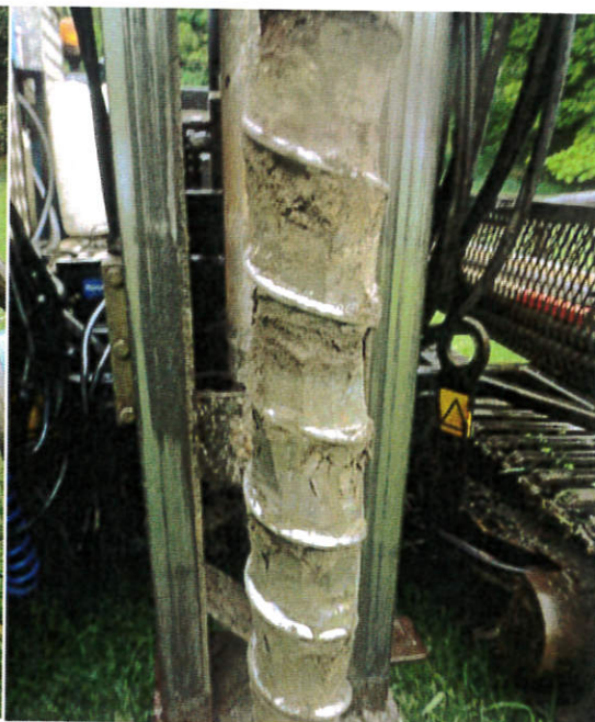
Figur 6: 16S004, 0-1,0 m