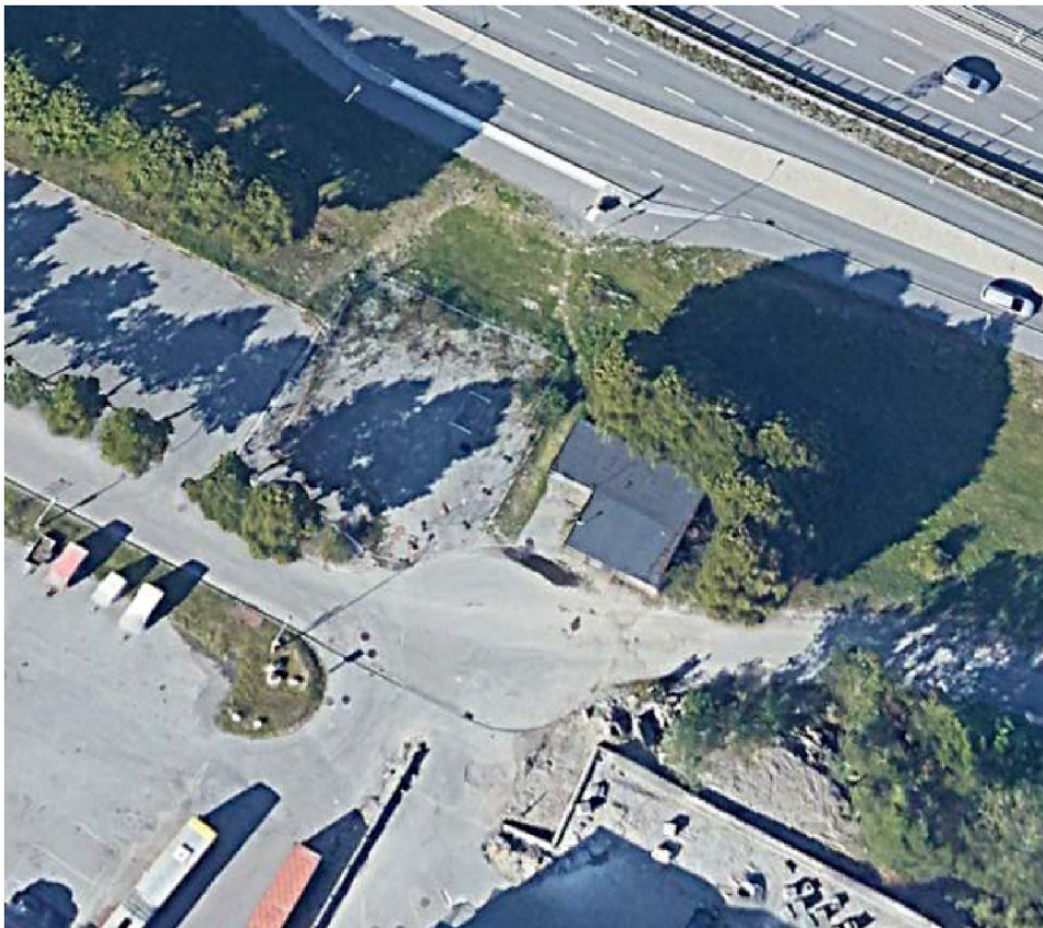
Fastighet Köping 2