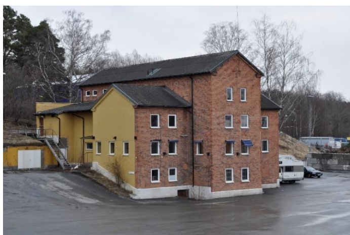
Den första sopförbränningsanläggningen från 1911 och som senare användes som kontor. Den västra gaveln i gul puts var hopbyggd med förbränningsugn och skyddsrum, vars byggnadsdelar revs 2006

Byggnaden har huvudsakligen en interiör från 1950-tal, från den tid då byggnaden användes som kontor. Mycket av inredningen är tidstypisk med fina detaljer och material. Exempelvis gabondörrar med glas, fönsterbrädor i marmor och badrumsinredning typisk för 1950-talet.