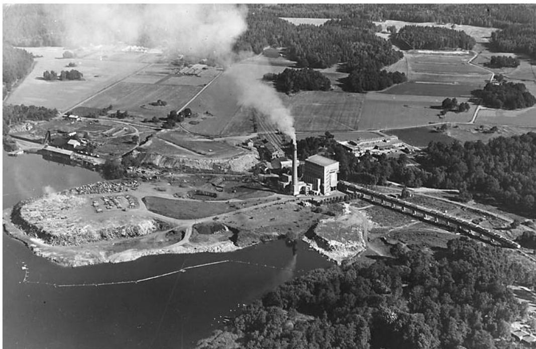
Lövsta sopförbränningsanläggning 1959.