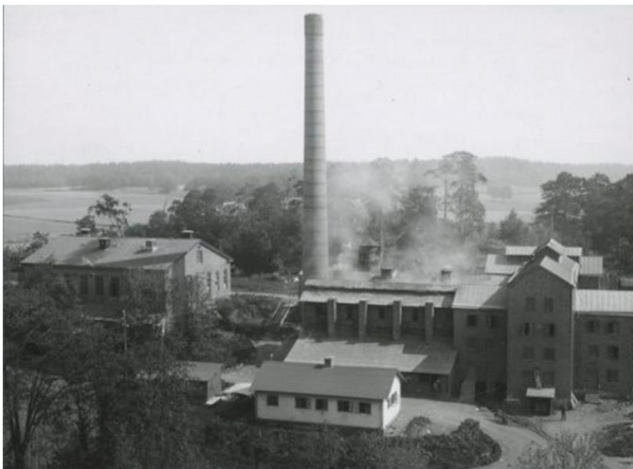
Vy över sopanläggningen 1937. Den första förbränningsanläggningen med manskapsbod och destruktionsanläggningen till vänster i bild.