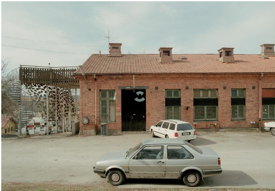
Byggnaden omkring 2003 med äldre fönster. 2003.