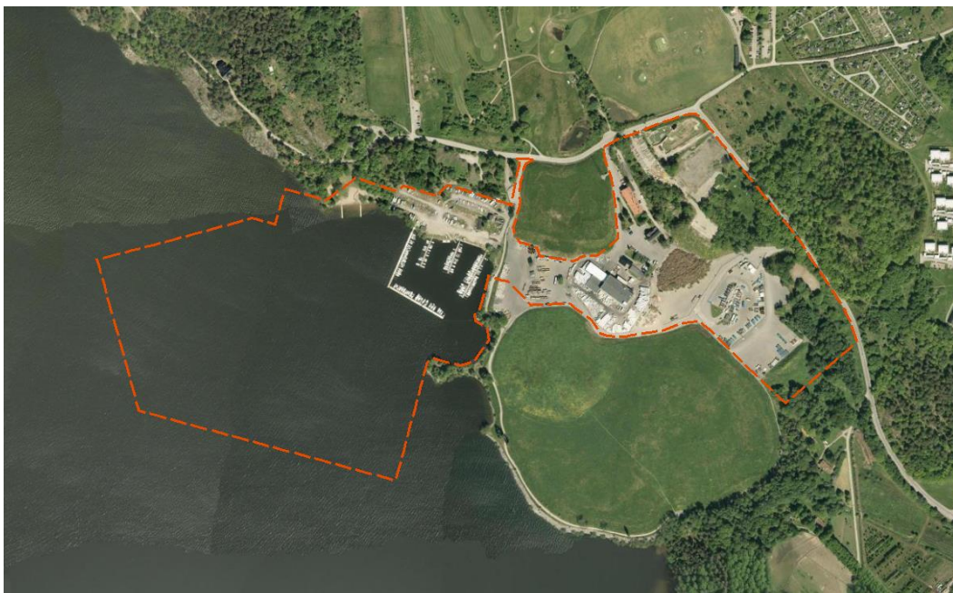
Ortofoto över Lövstas f.d. sopanläggning med plangräns för detaljplanen för kraftvärmeverket markerad med orange streckad linje.

Denna rapport syftar till att dokumentera och beskriva de kvarvarande byggnaderna som hört till Lövstas gamla renhållnings- och sopanläggning samt bedöma det kulturhistoriska värdet. En mer utförlig historisk beskrivning av Lövstas historia och dess omgivningar finns i den landskapsanalys som tagit fram av Sweco som underlag till föreslagen utveckling av Lövsta.