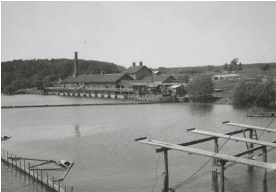
På platsen för dagens båtklubb låg Lövstas latrinstation och pudrettfabrik. I förgrunden syns lastbryggor för sållsopor. I vänstra hörnet syns den läns som förhindrade sopor att sprida sig i Mälaren. Lövsta 1937.