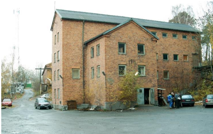
Byggnaden fotograferad 2003 i en dokumentation som gjordes vid Lövsta av Tekniska muséet. Byggnaden har sedan dess bytt fönster. 2003.