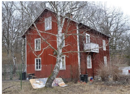
Den s.k. Svinvillan. Till vänster östra och norra fasaden. Till höger den västra och södra fasaden.