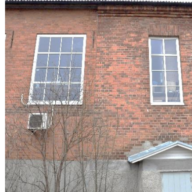
Vagnsverkstaden eller den första destruktionsanläggningens södra fasad. Till höger en inzoomad foto av fasaden som visar den äldsta delen och den nyare i en enklare fasadutformning utan den dekorativa gesimsen vid takfoten.