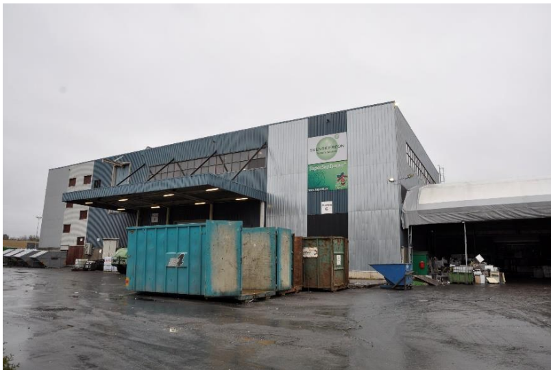
Byggnaden för automatisk materialåtervinning från 1970. Byggnaden används idag för freonåtervinning. Rör och transportband har rivits (jmf. Bild från 2003 ovan)

Denna byggnad är relativt oförändrad sedan den uppfördes. En tidigare transportbana från den nu rivna sopförbränningsanläggningen är borta samt höga rör/ skorstenar som möjligen haft en funktion i själva materialsorteringen (jmf. Bild ovan). Det finns även ett stort tält som lagrar kylskåp intill byggnaden. Byggnaden som till stor del utgörs av en stor hall, är enkelt utformad i blank plåt och korrugerad blå plåt. I den övre delen av byggnaden tas stora delen av fasaden upp av fönsterband för maximalt ljusinsläpp.