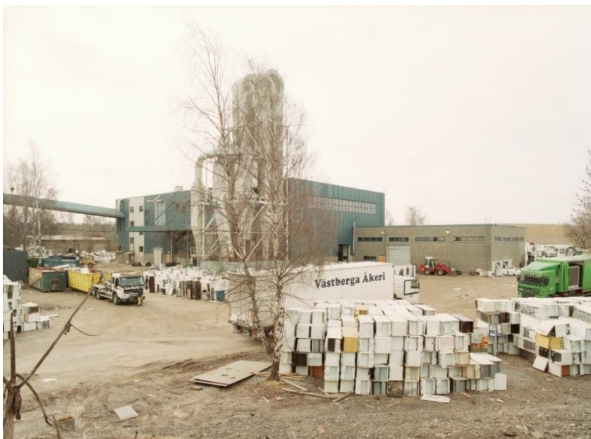
På 1970-talet uppfördes en försöksanläggning för automatisk sopsortering. Soporna kom från söföbränningsanläggningen via transportbandet till vänster i bild. Senare användes anläggningen för att omhänderta kylskåp för återvinning, en funktion som byggnaden har även idag. Källa Tekniska muséet. Fotograf Nisse Cronstrand. 2003.