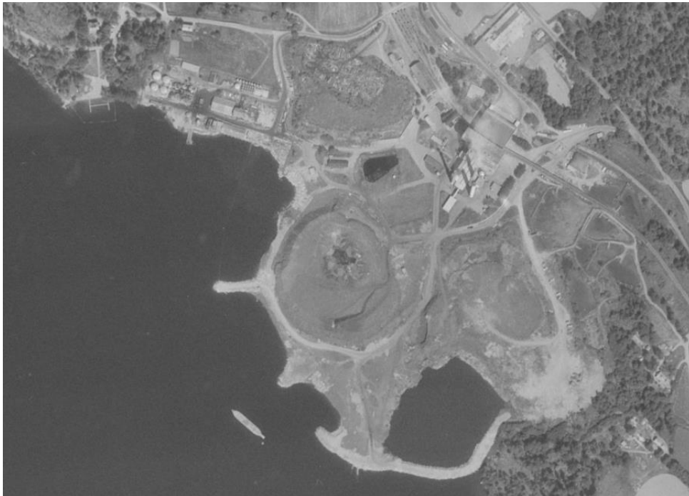
Ortofoto över anläggningen 1971. Järnvägen läggs ned vid denna tid. Sophögen och strandlinjen är förändrad sedan 1950-talet. På platsen för den före detta Pudrettfabriken och dagens småbåtshamn har ytterligare industriell verksamhet etablerats vid denna tid.