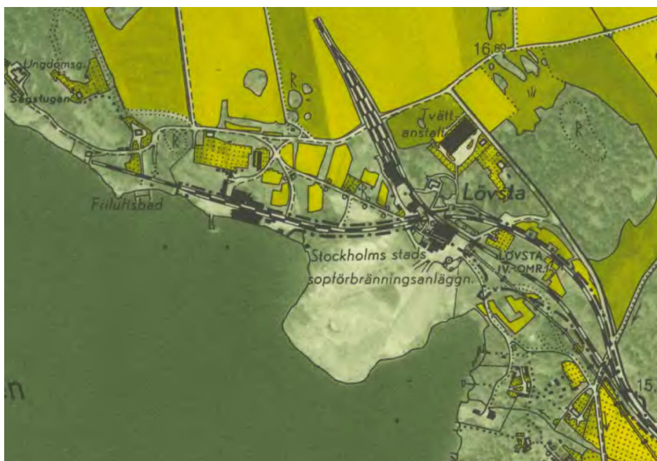
Den ekonomiska kartan över Lövsta sopanläggning 1958. Kartbilden visar järnvägsdragningen och spåren som leddes in i verkstaden. Den f.d. viken har vid denna tid fyllts med sopor. Intill latrinstationen och på samma plats som idag, fanns ett friluftsbad redan vid denna tid.