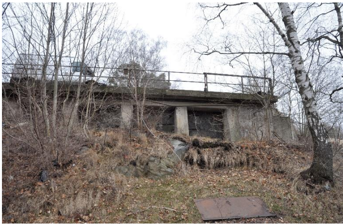
På den högre norra sidan gick tågrälsen. Det finns ännu spår av järnvägens bropelare öster om byggnaden. Järnvägsrälsen gick här på en viadukt in i området.