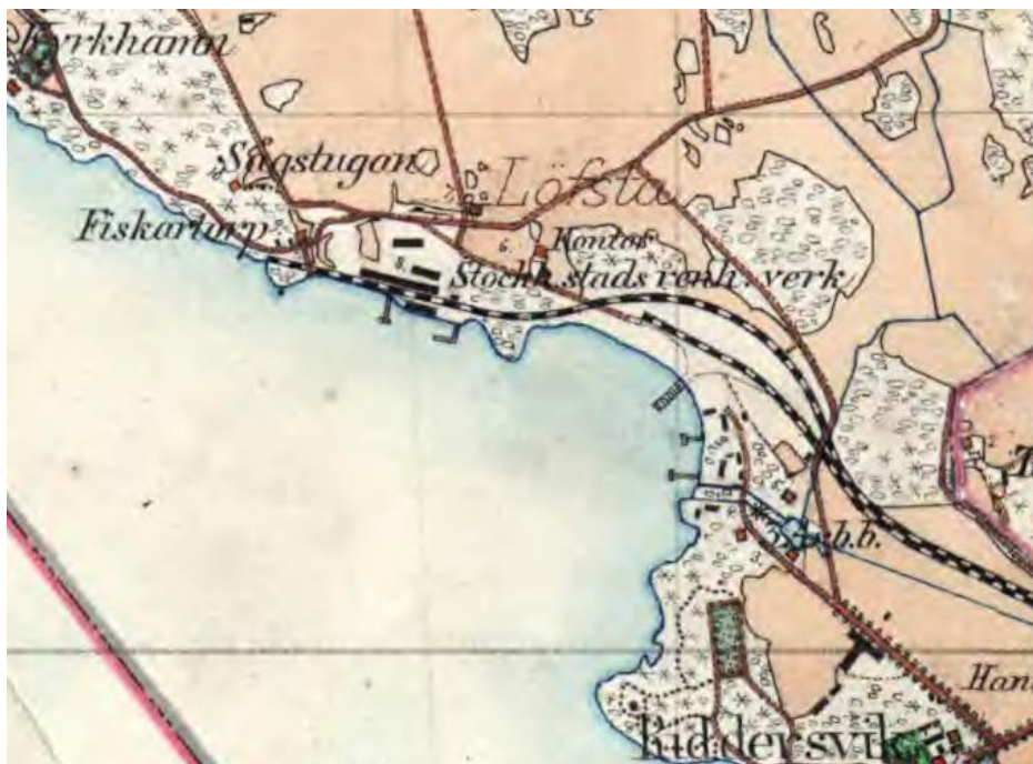
Den häradsekonomiska kartan från 1901 - 06 över Lövsta renhållningsstation, några år efter att anläggningen etablerats och järnvägen dragits fram. Här fanns då en vik med bryggor och som senare kom att fyllas med sopor. Vid vattnet (nuvarande småbåtshamn) låg latrinstationen och pudretfabrik