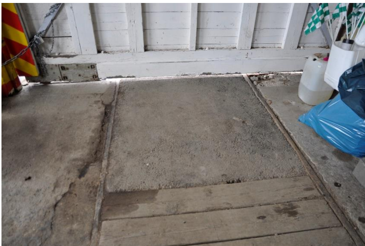
I den del som hyrs av golfklubben är byggnaden mindre förändrad interiört. Här syns tydligt spåren och en trälucka som troligen kunde lyftas vid service av tågen.