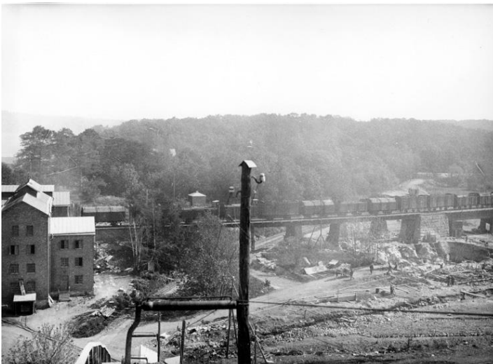
Tågen gick på en viadukt och lastade av soporna i sopförbränningsanläggningen (vänster i bild). 1930-tal.