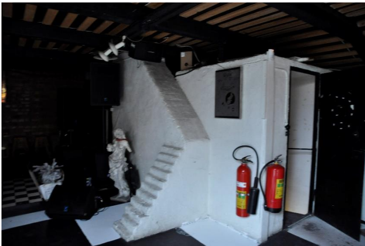
Murstock i den äldre byggnadsdelen som ursprungligen var destruktionsanläggningen.