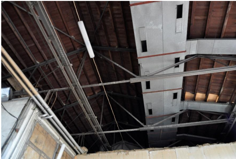
Den yngre och västra delen av byggnaden har full takhöjd. Äldre ljusriggar och viss annan teknik finns kvar.