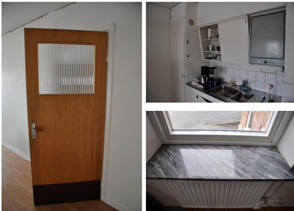
Interiöra bilder från kontoret med inredning typisk för 1950-talet i gedigna material.